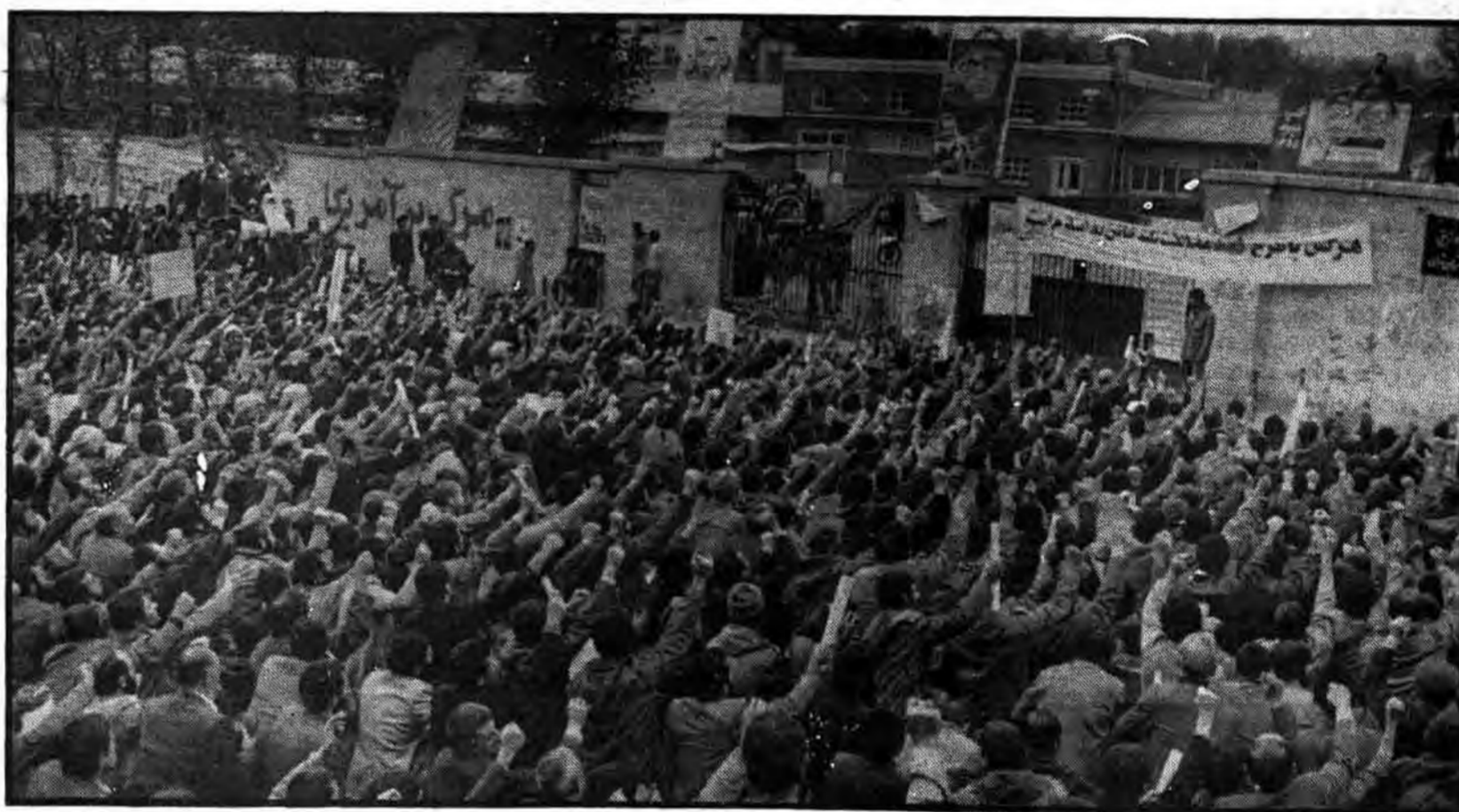
توطئه خائنان در برابر مشتهای گره کرده مردم، فرو می‌ریزد