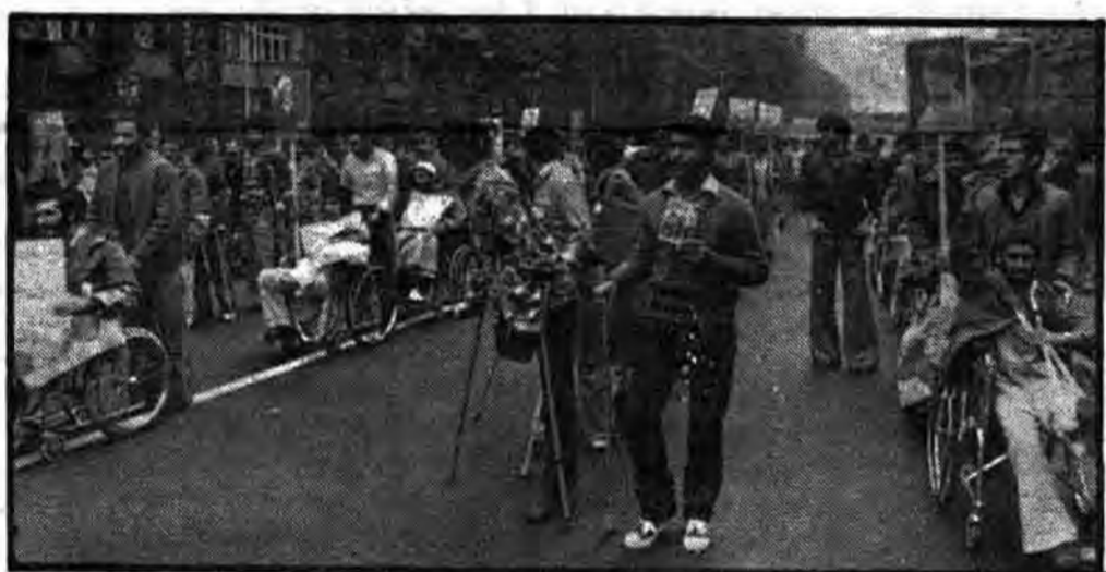
در هر زمانی رسوائی طرح ننگین برسمیت شناختن اسرائیل را، شهادت می‌دهند