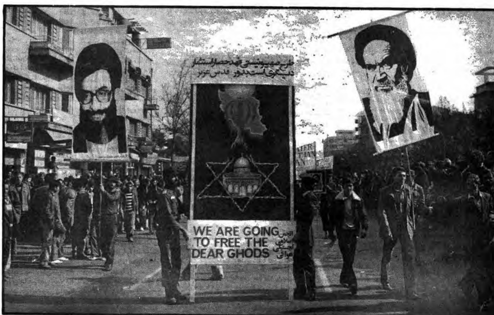
همه آمده‌اند تا شکست اشغالگران فلسطین را فریاد کنند