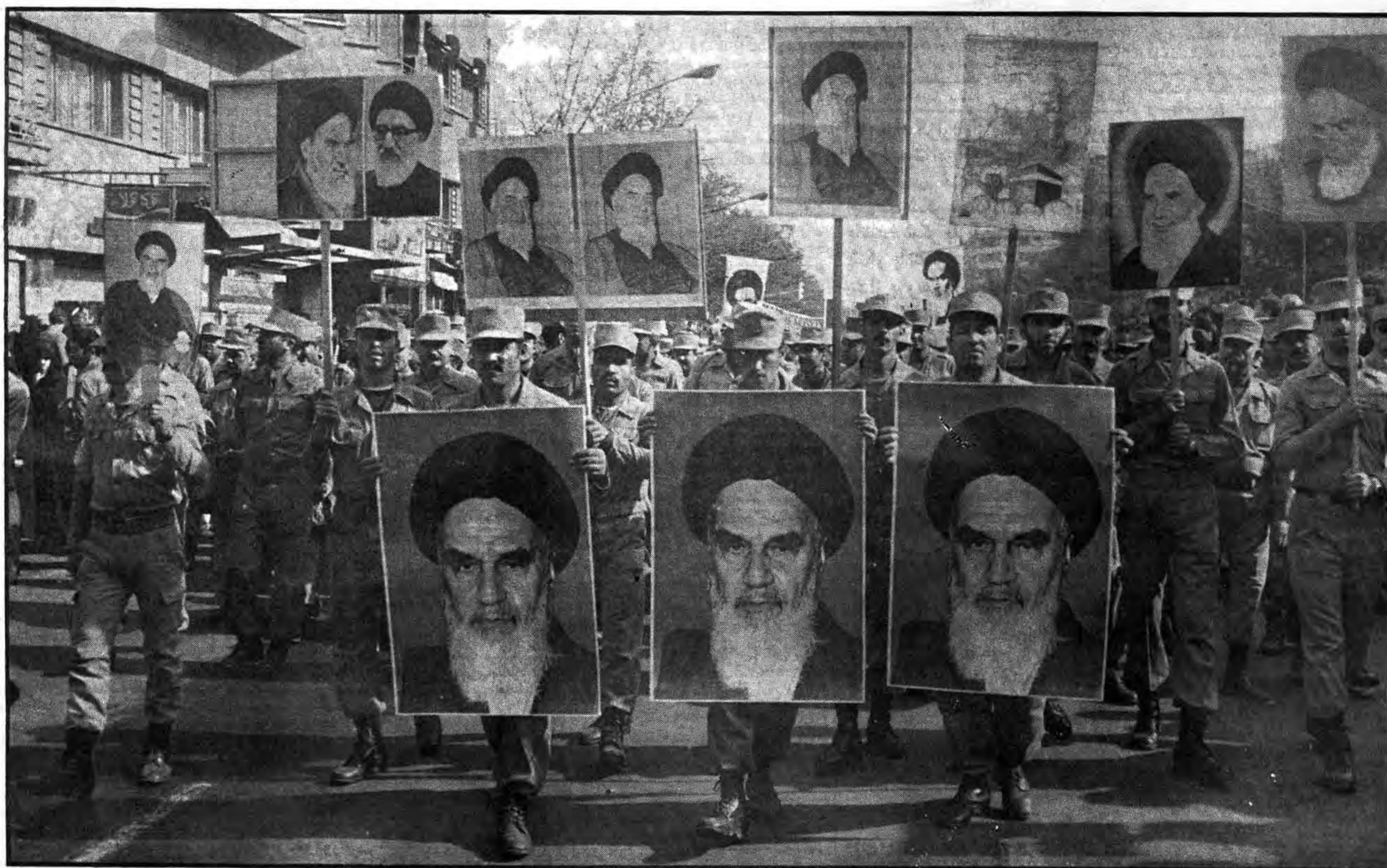
در استواری عزمها، به فتح قدس می‌رویم