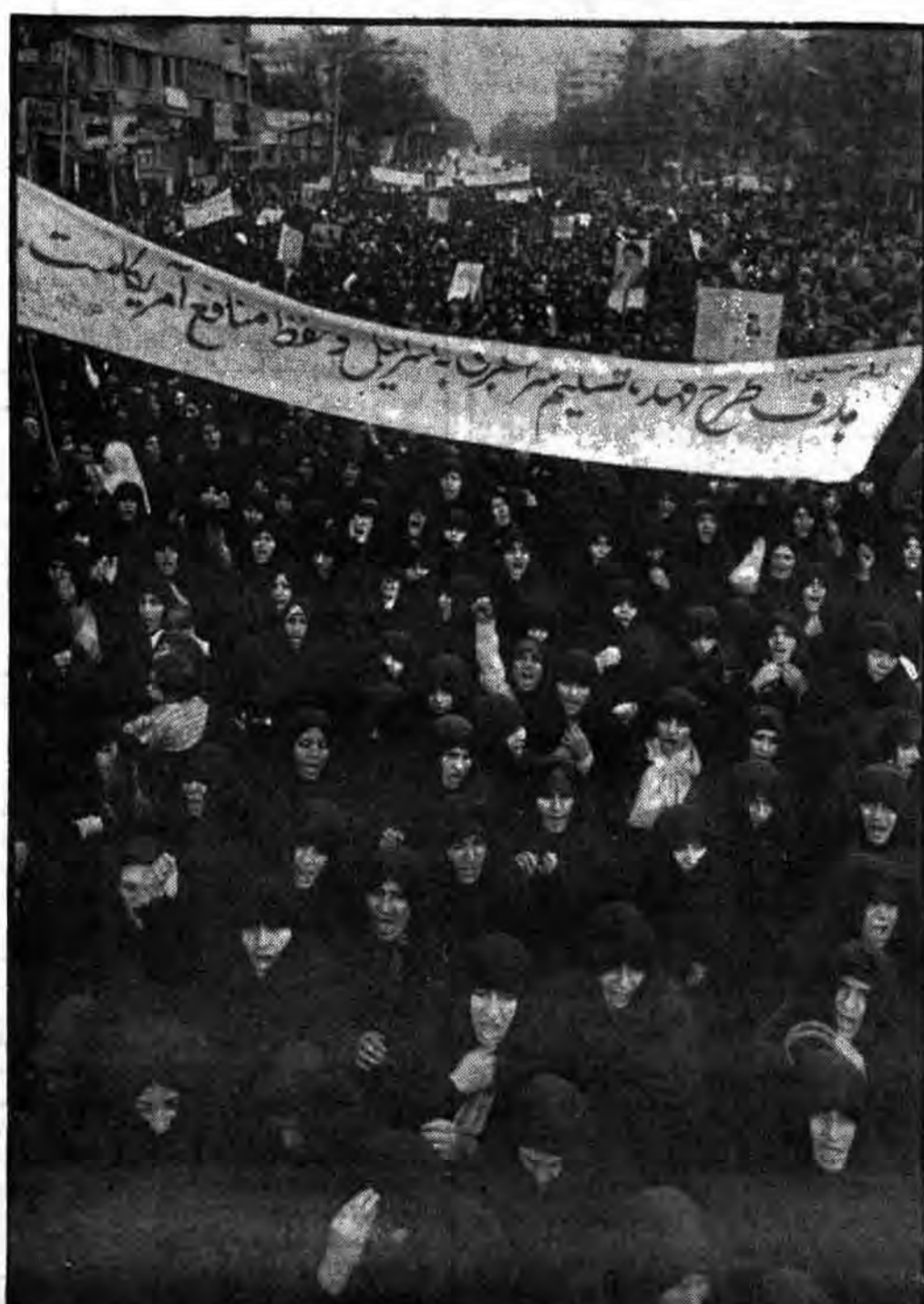
نفرت از اشغالگران قدس در فریاد مادران زجر دیده، به آیندگان آموخته