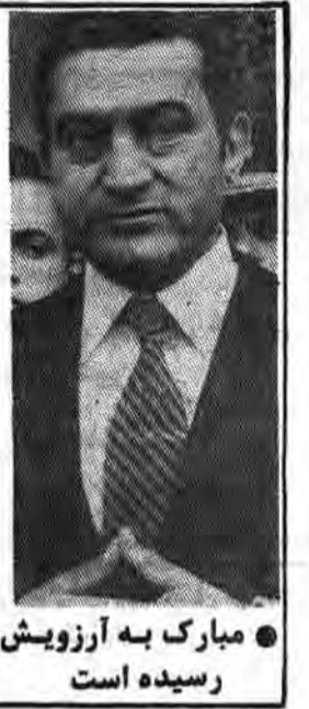
مبارک به آرزوی رسیدن است

حسینی مبارک در سال ۱۹۲۸ (۱۳۰۷) در استان الموفیه متولد شد. در سال ۱۹۴۸ (۱۳۲۶) وارد دانشگاه علوم نظامی شد و پس از دو سال به دانشکده نیروی هوایی ملحق گردید و در آن آموزش خلبانی دید. او سپس به شوری رفت تا دوره آموزش خلبانی را در آنجا ببیند. در سال ۱۹۶۷ (۱۳۴۶) بعنوان سیدر دانشکده نیروی هوایی تعیین شد و دو سال بعد بعنوان رئیس ستاد نیروی هوایی منصوب گردید. در سال ۱۹۷۲ (۱۳۵۱) بعنوان فرمانده کسل نیروی هوایی تعیین گردید و همراه سادات به مسکو رفت. هنگام جنگ اکتبر ۱۹۷۳ (۱۳۵۲) حسینی مبارک فرمانده نیروی هوایی مصر بود و نقش بسزوی در این جنگ بازی کرد. یکی از نزدیکان سادات بشمار می‌رفت، و در ملاقات‌های مهم سادات شرکت میکرد. او با یسک دختر انگلیسی بنام سوزان ازدواج کرده و دارای دو فرزند بنامهای علا و جمال میباشد.