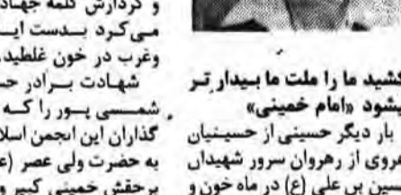
بشکشد ما را ملت ما بیدار تر میشود «امام خمینی» بار دیگر حسینی از حسینان رهبری از رهروان سرور پندشان حسین بن علی (ع) در ماه خون و پیروزی بدست مخالفین بخون

بای ذنب قنات غالبید. این سنت پیران حسین است که با قدرت ایمان هر لحظه کوینده تر از پیش دشمن اسلام را از سر خود بر میدارند. در صدم روز شنبه هفتم آذرماه حسین مجاهدان، این پیارو خمنی که در هر جا ظاهر میشد جوشی و حرکت و تلاش در جهت اسلام و در چهره‌اش و در اعمال و کردارش کلمه جهاد را مشق می‌کرد بنده‌ای ابدی است و غرر در خون غلبد.