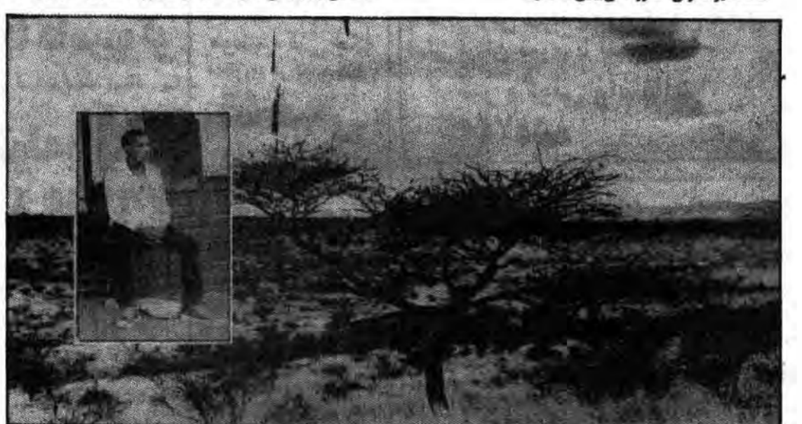
در سال ۱۹۶۶، دادگاه بین‌المللی در لاهه، هر گونه ادعاهای باقی مانده برای راه حل بین‌المللی نامی‌ها را نقش بر آب کرد و پس از سالها اجلاس و نظریات مشورتی، به قانون گراپانه ترین دلائل، حاضر شد رایی را به سود سواپو صادر کند. از آن زمان به بعد، حضور داخلی آفریقای جنوبی...

دوستان به پیشروی‌های محکم خود ادامه می‌دهد. دوستان به پیشروی‌های محکم خود ادامه می‌دهد.