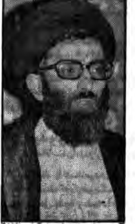
مجلسی که به فساد گرامیداشت... شهید مدرس برافراشت هرگز بر زمین نیفتاد...