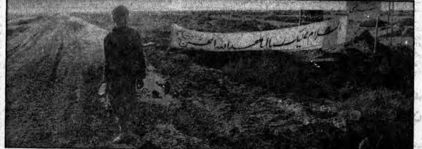
به چه می‌نگرد؟ او اینکه دروازه‌های قدس عزیز را بخوبی نظاره‌گر است و با قلبی مالاجال از شور و ایمان جادوی را که به قدس وصل خواهد شد حفاظت می‌کند. عکس جادوی را که توسط برادران جهاد سازندگی برای فتح بستان احداث شده بود را نشان میدهد.