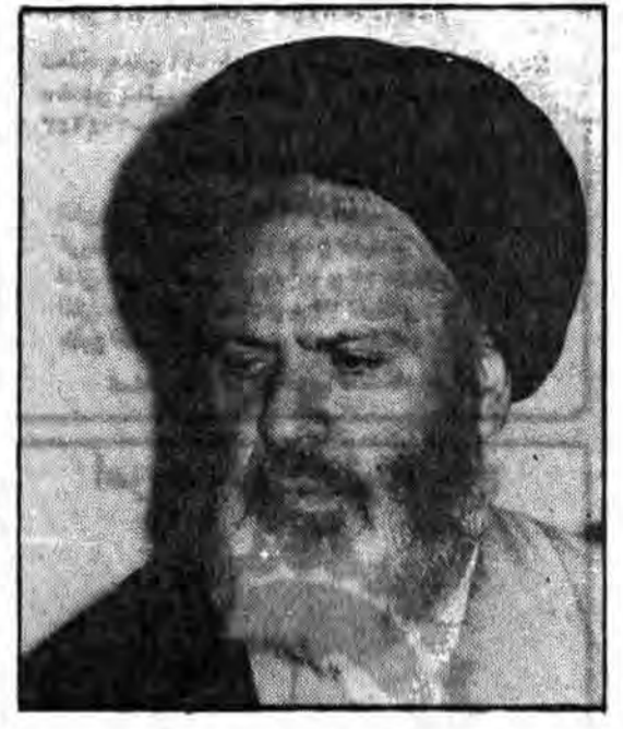
از سوی دادستانی کل انقلاب جمهوری اسلامی ایران بخشنامه‌ای خطاب به کلیه دادسراهای انقلاب اسلامی ایران و کلیه دادستانهای انقلاب اسلامی صادر شد. متن بخشنامه چنین است: