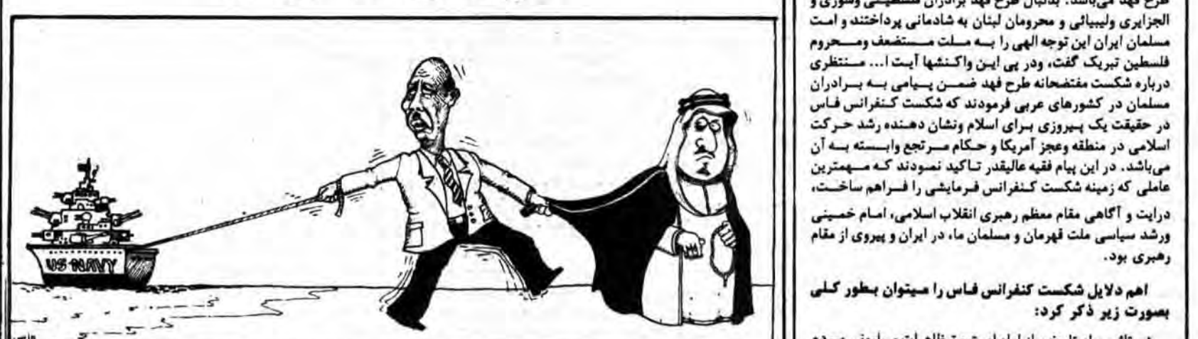
کوری نگر، عمارت کوری دیگر شده. از النهار الدولی والعربی چاپ لندن