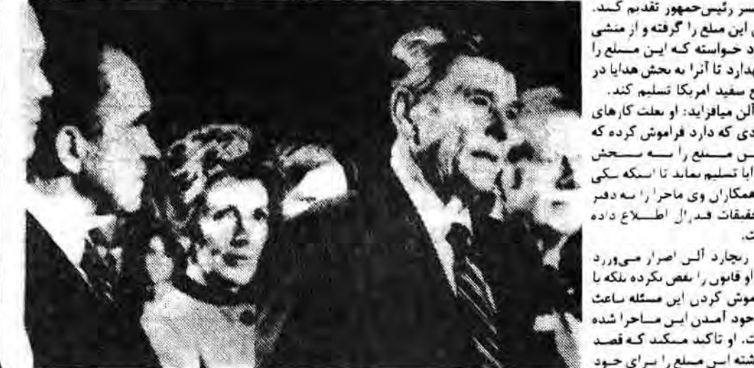
ریچارد الی، ریچارد نیکسون، روالد ریگان

ریچارد آلن در جریان یک مصاحبه با یک خبرنگار ژاپنی، در مورد یک حقیقتی که انجام گرفت پنهان می‌کند. این حقیقت آنست که ریچارد آلن در جریان یک مصاحبه با یک خبرنگار ژاپنی، در مورد یک حقیقتی که انجام گرفت پنهان می‌کند.