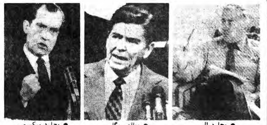
ریچارد الی، ریچارد نیکسون، روالد ریگان