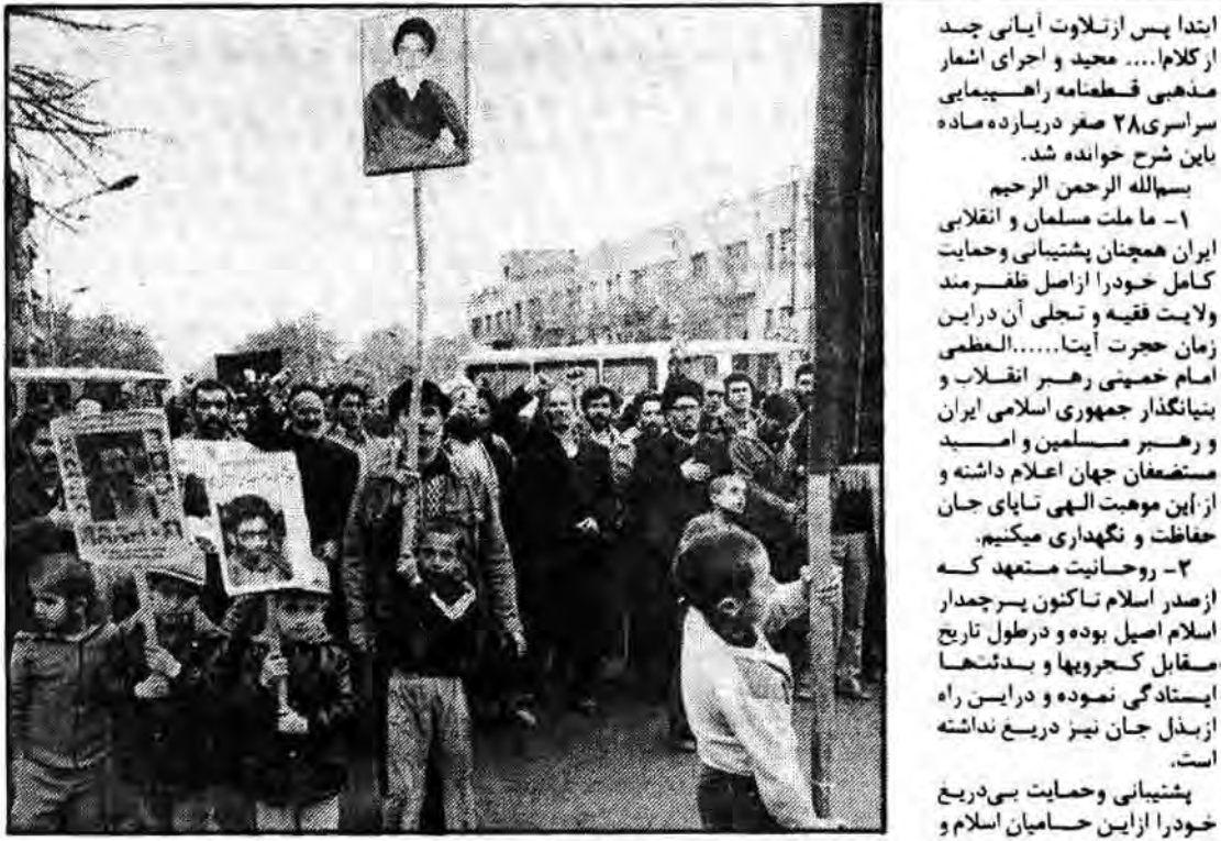
بگزارش خبرنگاران ما مردم مسلمانان ایران عظیم ترین مردم عزاداری ۲۸ صفر را بزرگوار کرد

سرویس خبری - دیهه سالروز شهادت داوختر کسانیک آسمان رسالت و ولایت محمد مصطفی (ص) و امام حسن مجتبی (ع) و بدعت شوری هماهنگی تبلیغات اسلامی امت قهرمان و شهید پرور ایران از اولین ساعات با مبادات دیروز بصورت دستجات عزاداری به خیابانها سرازیر شده و بسه سوگواران پرداختند.