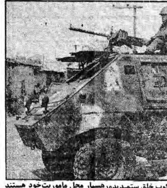
نیروهای ال سالوادوری برای سرکوب خلق ستمدیده در همسار محل ماموریت خود هستند

این نوع «تمرین» جنگی، نخستین تمرین است که ایالات متحده در ارتباط با تنها یک کشور (به جای چندین کشور آمریکای لاتین) انجام می‌دهد. این نشانه روشنی بر پیوستن‌های نزدیک میان «پیسولیکارپو» سازمان گارسیا رهبر رژیم هندوراس و حکومت «روالدوریگان»، رئیس جمهوری ایالات متحده است.