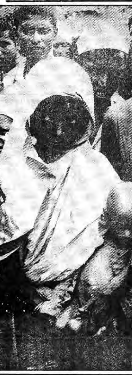
منازعه داخلی میان حکومت «میلتون اوپوت» (رهبر اوگاندا) و گروه‌های مخالف و همچنین بیم و نگرانی‌هایی که این وضع ایجاد کرده است به آن اضافه کنید. به این ترتیب، شما کابوس مداومی را مشاهده خواهید کرد که اکثریت جمعیت کشور آفریقای شرقی که از دیرباز دستخوش رنج و عذاب بوده است، با آن مواجه هستند.

سال ۱۹۸۱ به خاطر افزایش ربات میان شرق و غرب در آفریقا مشهور خواهد بود. سارمسی از رهبران زمین‌های مناطق دوردست نقل مکان کنند. تا کشاورزان سفیدپوست را قادر سازند زمین‌های بهتری را تصرف کنند.