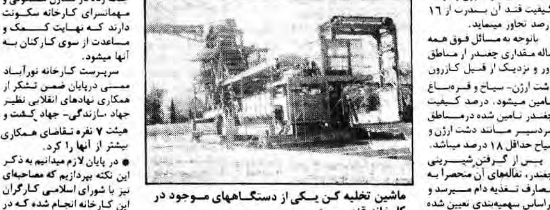
ماشین تخلیه کن یکی از دستگاههای موجود در کارخانه قند ممسنی

رابطه قند نورآباد ممسنی با کشاورزان به منظور تسهیل کشاورزان در امر تولید هرچه بیشتر چغندر قند، قیمت هر تن چغندر از ۵۰۰ ریال به ۲۰۰۰ ریال رسد افزایش پیدا کرده است. علاوه بر این در آراوز هر تن چغندر ۱۵ کیلو تالان آن برای خوراک دام و دام و گاو قند به کشاورزان داده میشود. از این مقدار یک کیلو قند به صورت رایگان و یک کیلو دیگر سارخ صنعتی به کشاورزان توزیع میگردد. رابطه قند نورآباد ممسنی با کشاورزان به منظور تسهیل کشاورزان در امر تولید هرچه بیشتر چغندر قند، قیمت هر تن چغندر از ۵۰۰ ریال به ۲۰۰۰ ریال رسد افزایش پیدا کرده است. علاوه بر این در آراوز هر تن چغندر ۱۵ کیلو تالان آن برای خوراک دام و دام و گاو قند به کشاورزان داده میشود. از این مقدار یک کیلو قند به صورت رایگان و یک کیلو دیگر سارخ صنعتی به کشاورزان توزیع میگردد.