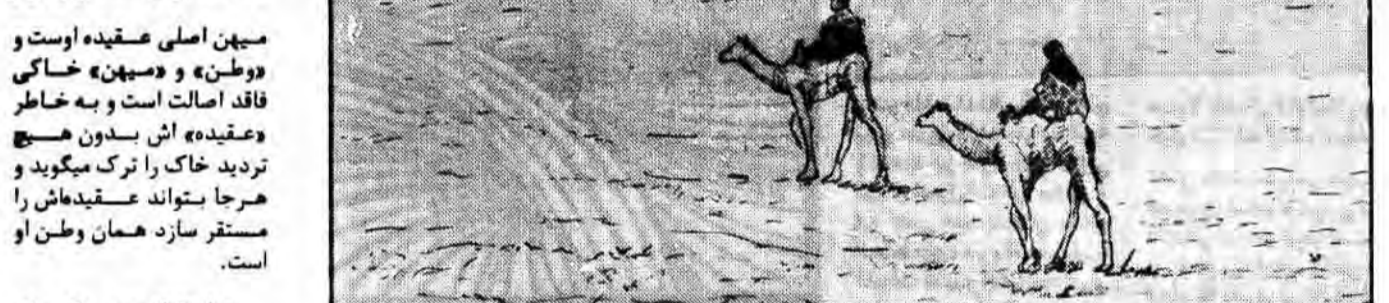
ایمان آوردن و هجرت از مکه به مدینه

اینها را به زمین نه چسبیده اند. می آید تا آتش نمود را گلزار کند و سپس همراه با ساره ولوط، برادر زاده اش عازم حران میگردد، و بازم هم مهاجرت میکند و پسوی کفاح حرکت میکند و پس از قحطی آنجا را نیز ترک میگوید و پسوی مصر آهنگ هجرت میکند و سپس به فلسطین و پس از آن به قدس جلیل (جسروت) هجرت مینماید. در نتیجه هجرت او است که «کعبه» خانه خدا تعمیر میگردد. موسی با همراهان خود دست به «هجرت» میزنند و در نتیجه این هجرت است که «فرعون» عسرق میشود و موسی مأمور میگردد مصر را ترک گوید و در «ارض مقدسه» هجرت نموده آنجا مقدمات ساختن یک جامعه توحیدی خداپرستان را فراهم سازد. با تعمق در آیات قرآن در پیامیم که سنت پیامبران این بوده که هر وقت تلاشی اصلاحی آنان، باخطر نبودن زمینه پذیرش حق در افراد آن یا باخطر پیروها توده های آن سامان یا بنسبت روبرو شده است، آنان دست به هجرت زده اند. آنان تلاش اصلاحی خود را هیچگاه به هیچ قیمتی و در هیچ موقعیتی متوقف نمیگرداند و به هیچ