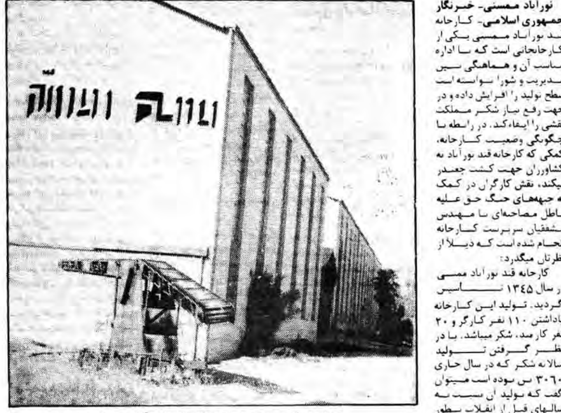
نمایی از قسمت بیرونی کارخانه قند نور آباد ممسنی