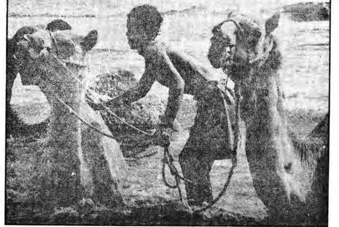
● یک سومالی شترهای خود را در دریا می شوید