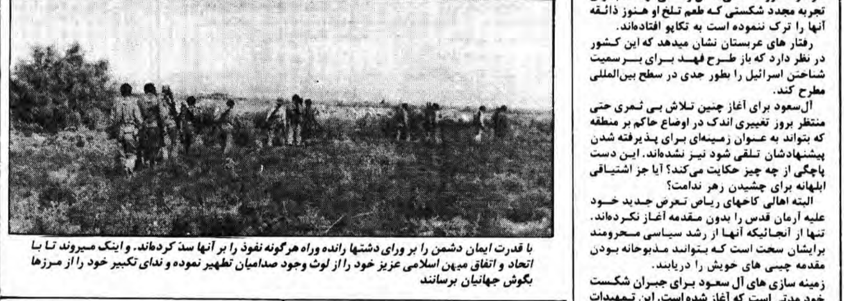
با قدرت ایمان دشمن را بر وای دشتها رانده و راه هرگونه نفوذ را بر آنها سد کرده‌اند. و اینک میروان تا با اتحاد و اتفاق میهن اسلامی عزیز خود را از لوث وجود صدامیان تطهیر نموده و ندای تکبیر خود را از مرزها بگوش جهانیان برسانند

● ۵۰ سنگر دشمن در منطقه هرگنه عراق منهدم شد ● سه تانک دشمن در نوار مرزی پاره منهدم و ۴۰ قبضه کلاشینکف به غنیمت گرفته شد ● در جریان عملیات محمد رسول... (ص): پزشک نظامی عراق پس از اسارت در بیمارستان میروان به مداوا پرداخت