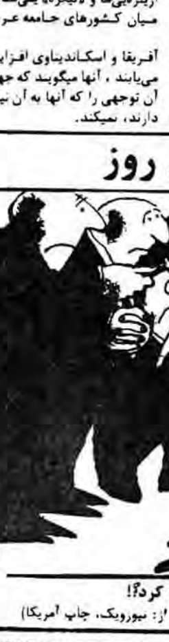
این گربه مکار، از فرصت! استفاده کرد!