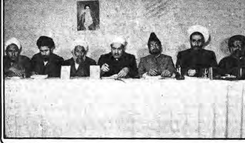
بدنبال تجاوز مزدوران عراقی به ۲۰ دختر در بستان و شهادت رساندن آنان: ایران یکبار دیگر سازمانهای بین‌المللی را دعوت به مشاهده جنایات رژیم عراق کرد