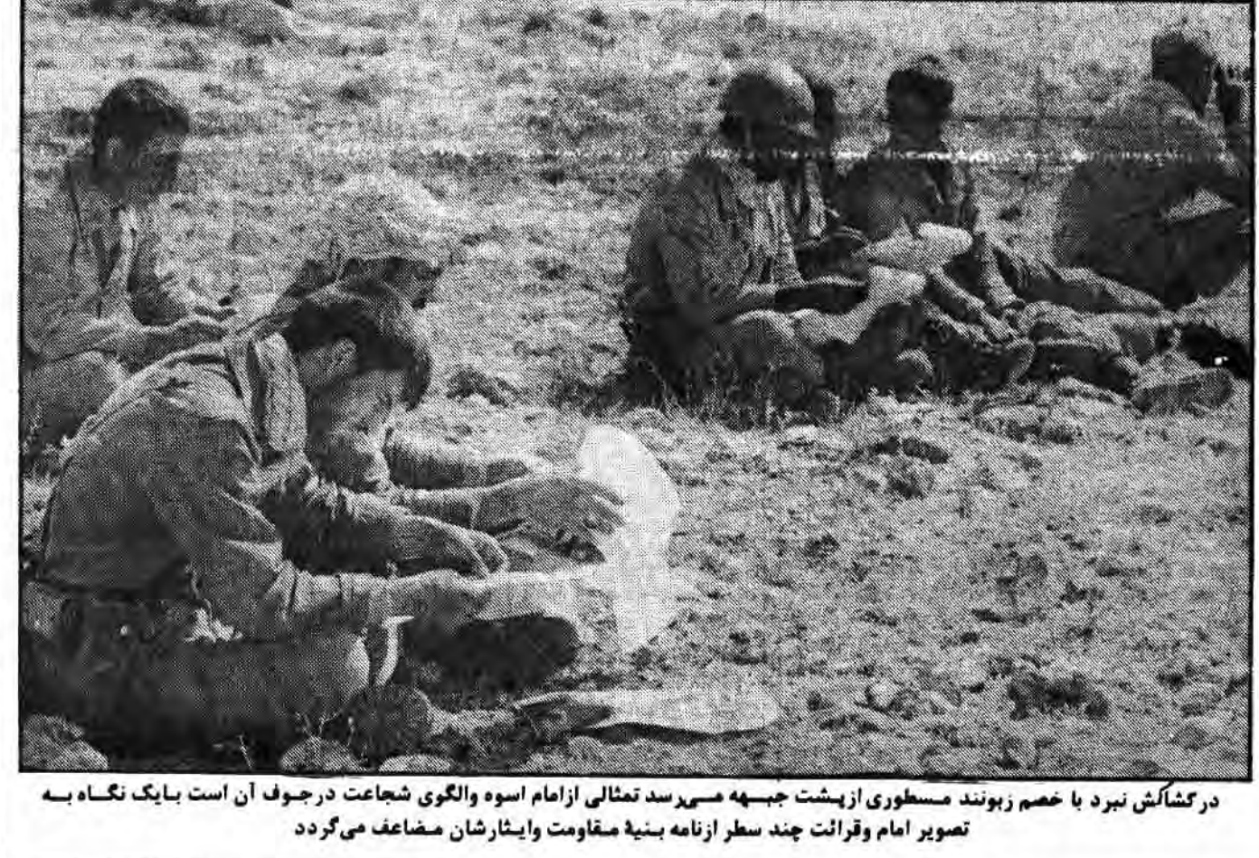
در کشاکش نبرد با خصم زبونند مسطوری از پشت جبهه می‌رسد مثالی از امام اسوه والگویی شجاعت در جوف آن است بایک نگاه به تصویر امام و قرانت چند سطر از نامه بنیة مقاومت و ایثارشان مضاعف می‌گردد

بمناسبت میلاد رسول اکرم (ص) و به فرمان رهبر کبیر انقلاب: ۷ نفر از محکومین دادگاههای ارتش آزاد شدند ● به همین مناسبت در شهر قم نیز ۲۰۹ زندانی آزاد شدند. در صفحه ۲