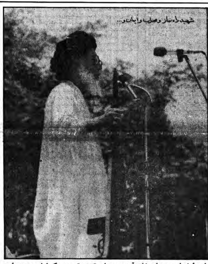
ای با خدا به همدلی خلق آمده، هر پاره تبت، تصویر یک امام به محراب می‌برد.

تاسیسات مذکور همچنان در آتش می‌سوزد کاتوشا و ۸۴ مزدور صدام در جبهه‌های غرب نابود شدند خودرو در پارکینگ موتوری دشمن در منطقه ذهاب منهدم شد فدائیان امام یکان نفوذی دشمن به گاو میشان را مجبور به عقب نشینی کردند در صفحه ۲