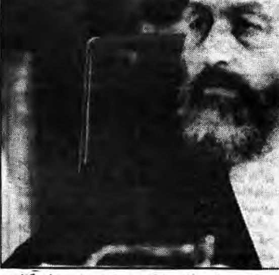
آیت الله العظمی بزرگوار