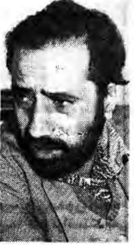
جامعه یک مرجع و پیمای برای رسیدگی به شکایت امور صنفی نباشد، ما اینجا وظیفه داریم و باید انجام وظیفه کردیم و امید است معذب بوده باشد.

دبیدار مشاهده اختلافی در امر توزیع کالا از جمله در سطح شهر تهران بر آن شدیم که علت این امر را یافته و نقطه نظر مسئولان را در این زمینه بدانیم لذا پس از تحقیقات اولیه از مردم در سطح شهر به سراغ ائمه جماعات مساجد رفته و ضمن گفتگو با آنان متوجه شدیم که ستادهای مبارزه با گرانفروشی مسئول اینکار هستند و بعد از تماس با برخی از ستادهای ۲۰ گانه و فرعی بیدار مسئولین داد گاه و دادسرای انقلاب اسلامی تهران ویژه امور صنفی رفته و با آنان گفتگویی انجام دادیم که در ذیل از نظر آنان می گذرد: