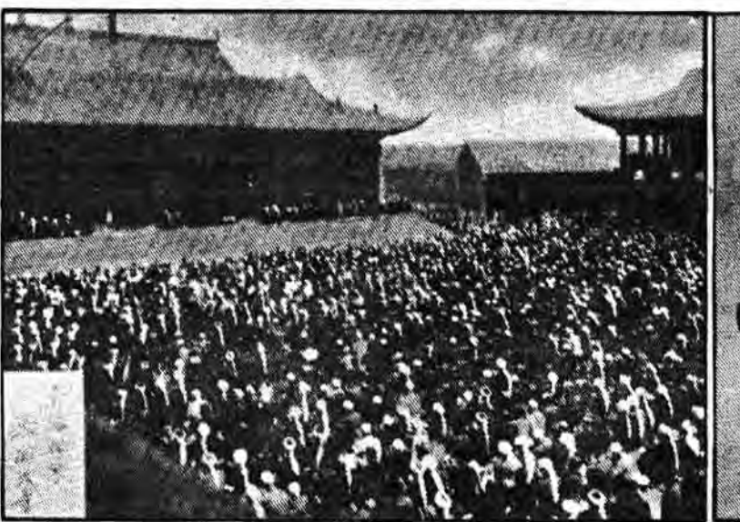
مسلمانان نماز جمعه را در مسجد «دونگ کوان» به جا می آورند.