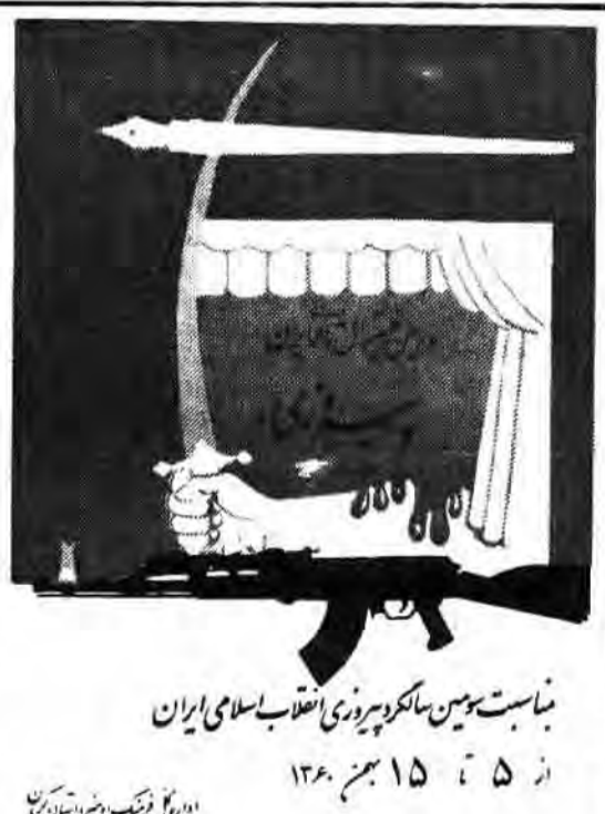
نمایش «پسین ساگر پیروزی» انقلاب اسلامی ایران ۱۳۸۰ بهمن ۱۵ اداره کل فرهنگ و هنر استان کرمان

برپائی دومین فستیوال تئاتر انقلاب اسلامی: «۵ تا ۱۵ بهمن کرمان» با فرارسیدن آغاز سومین سالگشت شکوهمند پیروزی انقلاب اسلامی ایران دومین فستیوال تئاتر با عنوان «پیروزی» از ۵ تا ۱۵ بهمن ماه سال ۶۰ در کرمان به همت و تلاش اداره کل فرهنگ و هنر استان کرمان و با همکاری روابط عمومی ستاد منطقه ۶ سپاه پاسداران برگزار میگردد. این حرکت تداومی است در جهت رشد واحیاء ارزشهای اصیل و پویای هنر نمایشی بعد از انقلاب که با صحنه رتن گروه های نمایشی سه استان- کرمان- سیستان و بلوچستان و هرمزگان شکل میگردد. برپائی اولین فستیوال تئاتر انقلاب را در پاییز ۶۰ در شهر مقاومت و همیشه استوار اهواز شاهد بودیم که حاصل کار صوفی گروه های نمایشی استان ایستارگر خوزستان بود.