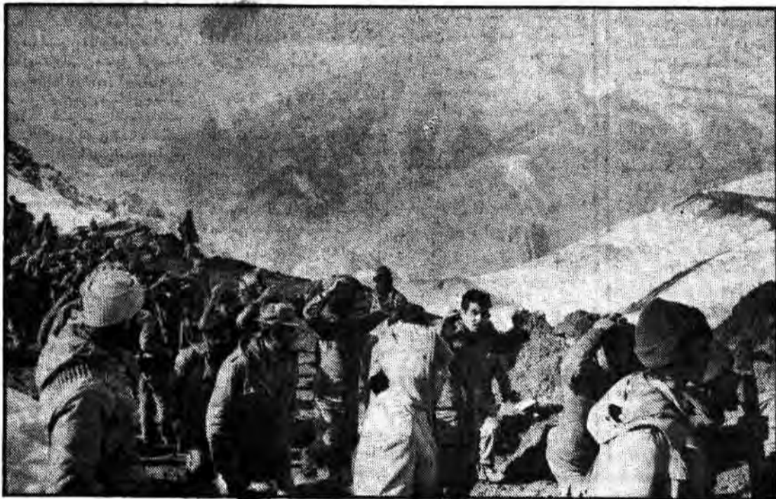
جبهه های غرب هر روزه شاهد اسارت عدده دیگری از مزدوران عراقی است. مزدوران بعثی در حالیکه قادر به ایستادگی در برابر نیروهای قدرتمند ارتش اسلام نیستند، دستهای خود را بلاطت اسارت بالا برداند. این عکس چگونگی انتقال اسرای عراقی در یکی از جبهه های غرب را نشان میدهد

عربستان در مسیر تحریم نفتی علیه آمریکا کار شکنی می کند ● دربار سعودی اعلام کرد از سرسختی و مبارزه علیه اسرائیل، سودی حاصل نخواهد شد! ● رادیو عربستان بدون توجه به موضع خصمانه آمریکا گفت: میانروی بعضی دولت های عرب بیش از سرسختی سایرین سودبخش است! ● الجزایر از پیشنهاد تحریم نفتی آمریکا جانبداری کرد در صفحه ۳