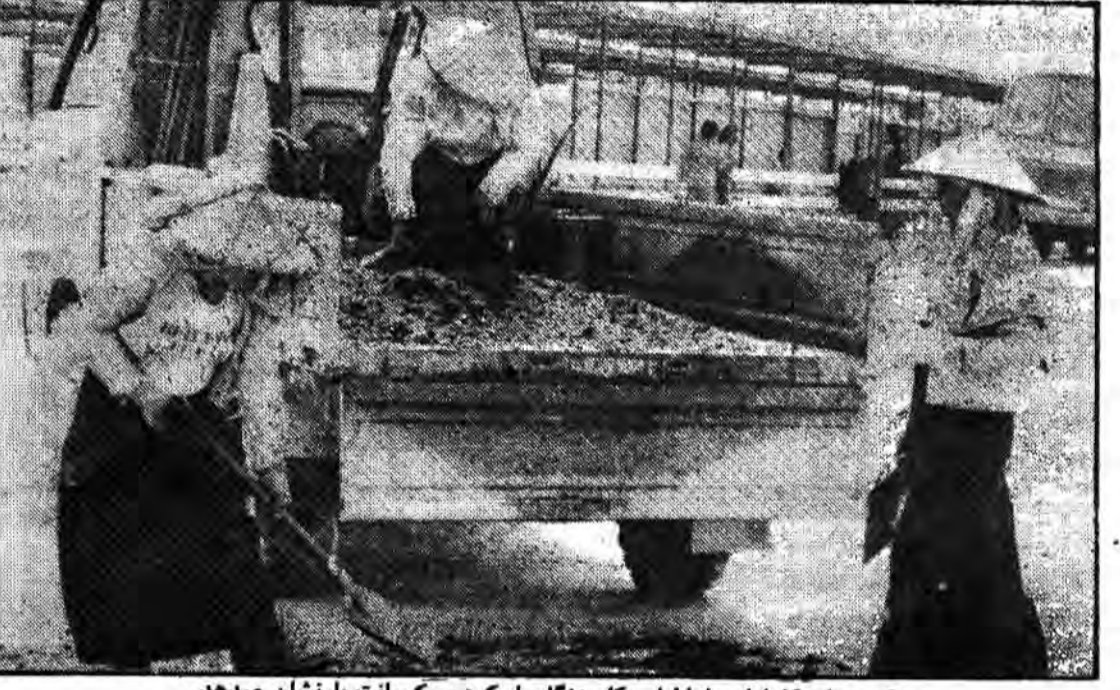
عکس زنان کادازان را با لباس کار هنگام بار کردن یک وانت بار نشان میدهد.