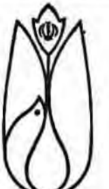
مقام مسئولین مراسم سومین سالگرد پیروزی انقلاب اسلامی