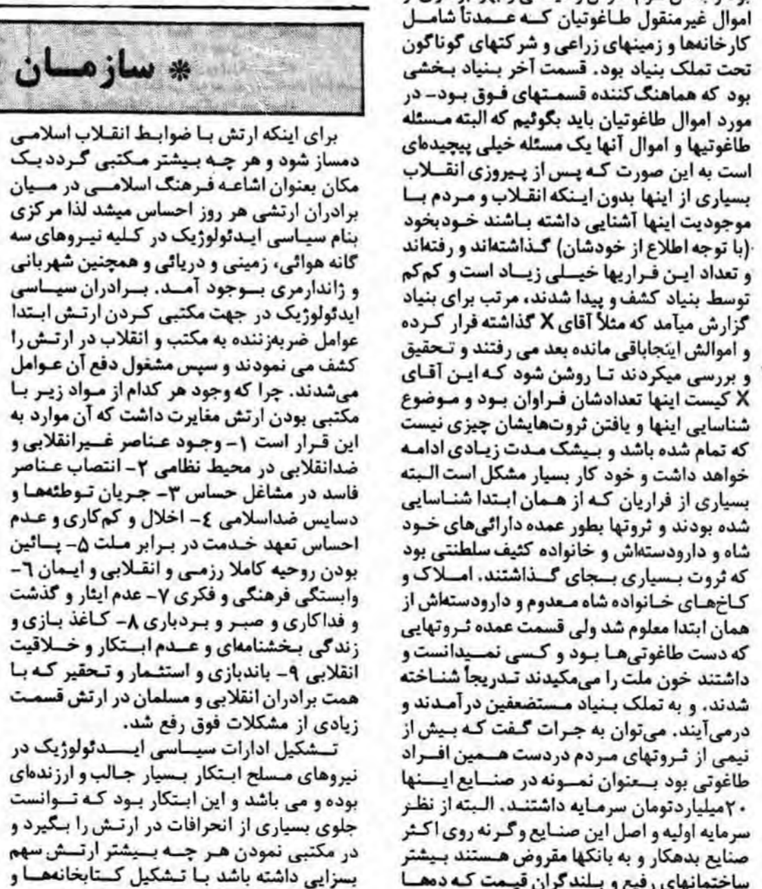
بهمدر صفحه ۷

بدر مردمی مانند ارتش باشیم و اعتقاد بر این است که تنها و تنها عصر مکتب است که می تواند حافظ مردمی بودن ارتش باشد. کشور ما تنها در صورتی حاضر است به ارتش خود مطمئن باشد و در کنار او بماند که ببیند راهنمای عمل نیروهای مسلح نه افسران عملیاتی و اطلاعاتی و لجستکی خارجه که عترت و سنت است، ارتش مکتبی الذا مردمی است و چنین ارتشی هرگز خیانت نخواهد کرد و هرگز باز بچه توطئه‌های