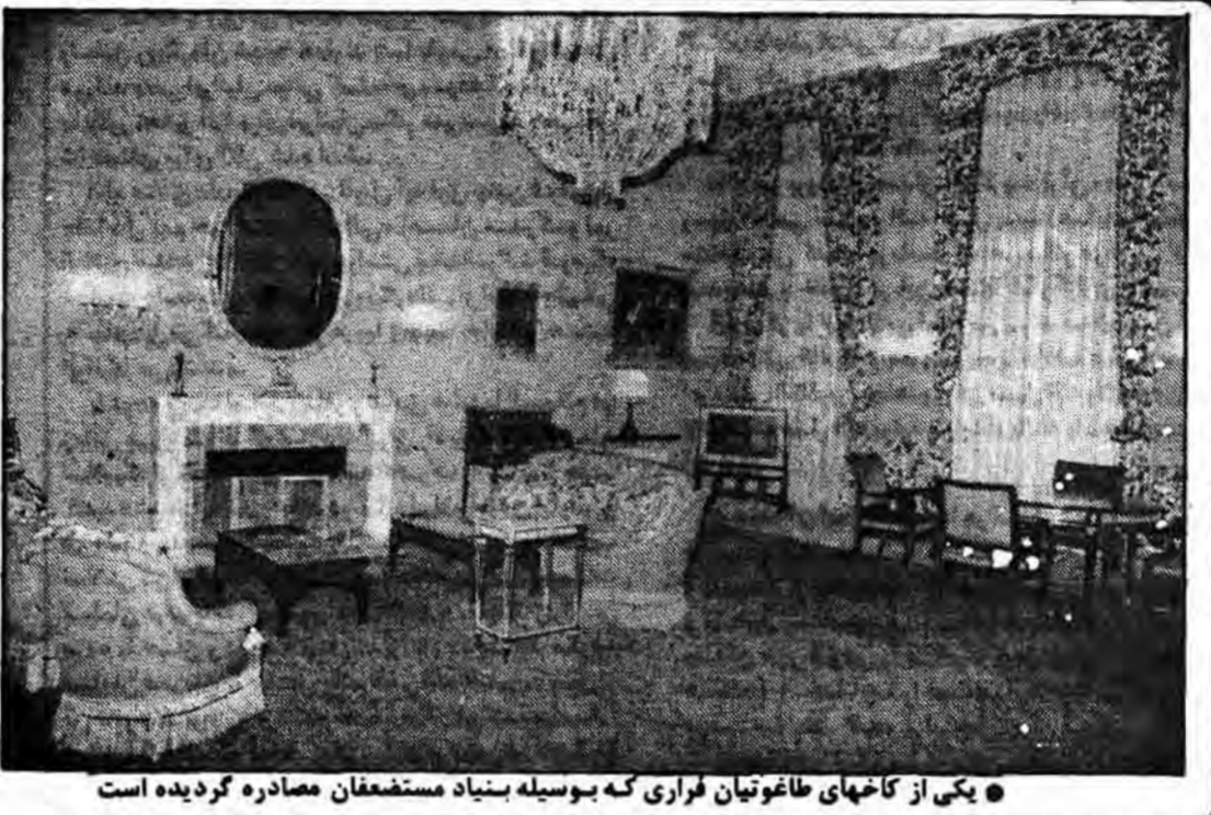
یکی از کاخهای طاغوتیان فراری که بوسیله بنیاد مستضعفان مصادره گردیده است