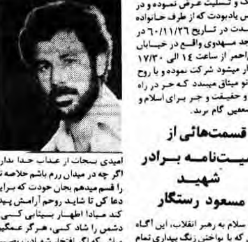
پاسدار شهید مسعود رستگار