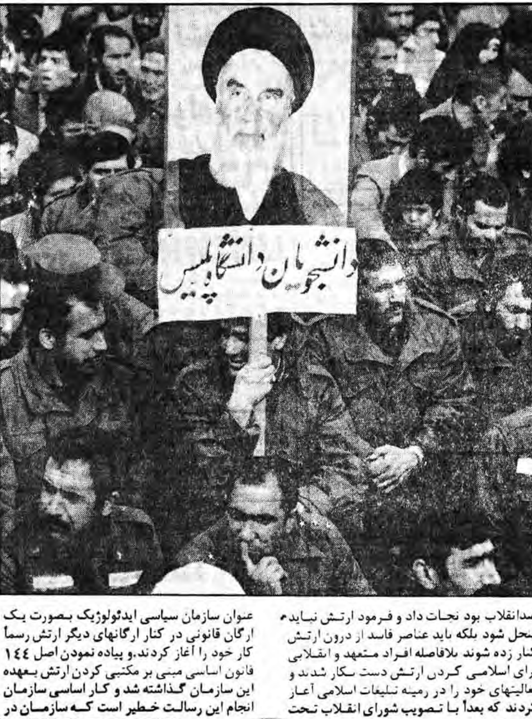
عنوان سازمان سیاسی ایدئولوژیک بصورت یک ارگان قانونی در کنار ارگانهای دیگر ارتش رسماً کار خود را آغاز کردند.

برادران نظامی را در این جهت آگاه نمود. هدف دیگر از تشکیل سازمان سیاسی ایدئولوژیک این بود که می دانیم یکی از مسائلی که در سازمان سیاسی ایدئولوژیک بسیار بود که توانست جلوی بسیاری از انحرافات در ارتش را بگیرد و در مکتبی نمودن هرچه بیشتر ارتش سهم بسزائی داشته باشد. مهمترین وظیفه سازمان سیاسی ایدئولوژیک دادن شناخت به نیروهای مسلح است.