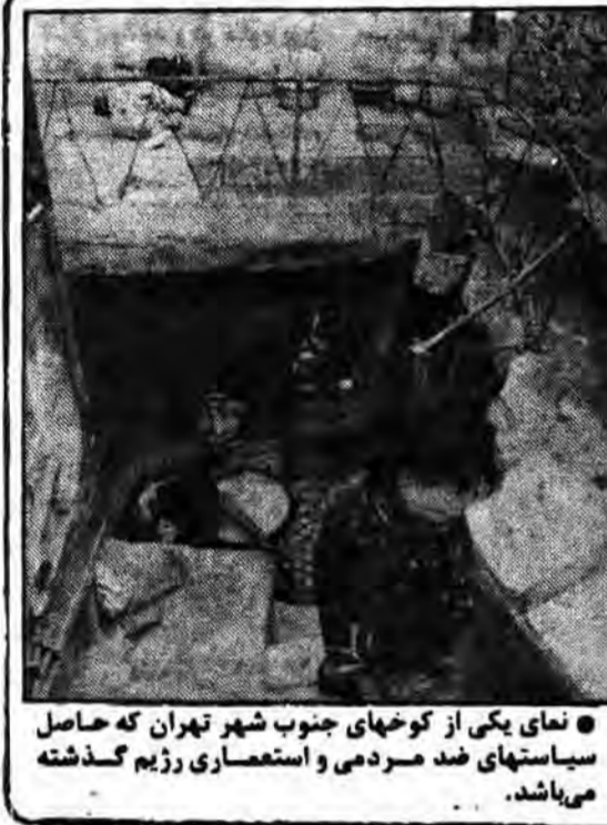
نمای یکی از کوچه‌های جنوب شهر تهران که حاصل سیاستهای ضد مردمی و استعماری رژیم گذشته می‌باشد.

صادره ساختمانیهای سرمایه‌داران و بکار گرفتن آن در جهت مستضعفین از جمله کارهای دیگر بنیاد میباشد همچنین در کمک‌رسانی به جبهه‌های جنگ کمکهای فراوانی نمود و برای کمک هر چه بیشتر به جنگ‌زدگان و جبهه‌های جنگ ستادهایی از طرف این بنیاد تشکیل شد که در امر کمک‌رسانی خدمات شایانی نیز نمودند. اکثر واحدهای مسکونی برای اسکان جنگ‌زدگان توسط بنیاد مستضعفان ساخته شد بعنوان مثال در تاریخ ۵۹/۸/۱۵ اعلام گردید که به همت بنیاد مستضعفان و کمک مردم ده هزار واحد مسکونی برای مناطق جنگ‌زده ساخته میشود. اکثر این خدمات و خدماتی که بعداً اشاره خواهد شد بنیاد در زمان سرپرستی برادر رجائی در بنیاد، تحقق پذیرفت. بنیاد مستضعفان حدود ۵۰۰ شرکت دارد که یکی از این شرکتها بنیاد هنری میباشد. در پایان فعالیتهایی که بنیاد تاکنون انجام داده است بطور اختصار آورده میشود. گزارشی مختصر از فعالیتهای بنیاد مستضعفان ۱- مصادره اموال فراریان و وابستگان شاه و خود شاه و کاخ و ساختمانها