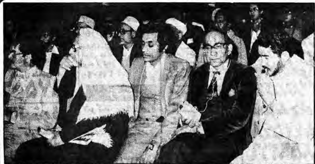
گروهی از مسلمانان آفریقای جنوبی که در مراسم دهه فجر شرکت کردهاند