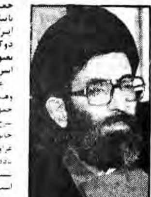
نماینده کلیه درجسه دیروز مجلس شورای اسلامی.

وزیر خارجه ایران در یکی از مساجد الجزایر، با اشاره به بن‌بست جهانی، گفت: تنها راه نجات دنیا از بن‌بست، اسلام است. وی افزود: اسلام راه نجات دنیاست.