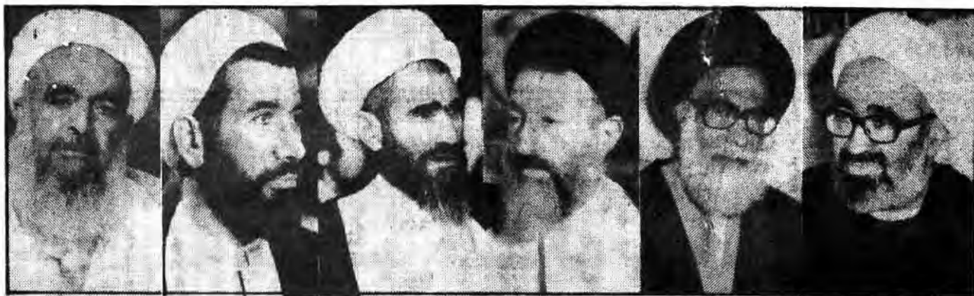
آیت‌الله منتظری، آیت‌الله دستغیب، آیت‌الله بهشتی، آیت‌الله عسکری، آیت‌الله اسلام باهر، آیت‌الله صدوقی

سومین دبیر کل حزب جمهوری اسلامی برای نخستین بار بازگو کرد: