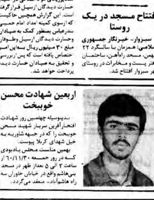
بسم رب الشهداء و الصدیقین