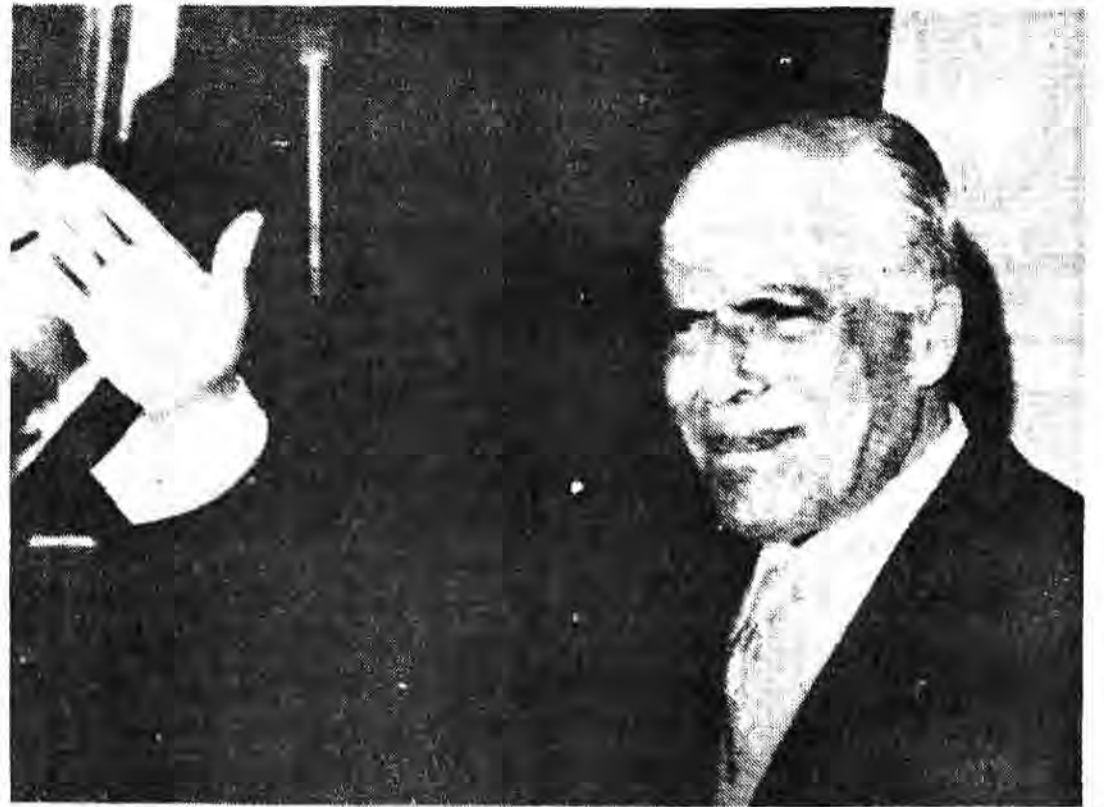
برقیه دیکتاتور تونس