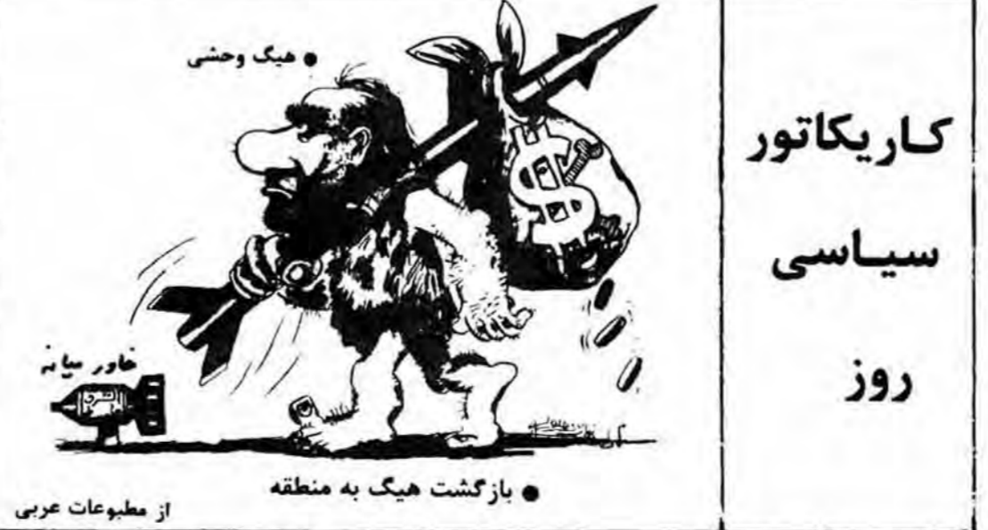
کاریکاتور سیاسی روز

جرسی اوربان یک روزنامه نگار سابق است که یکبار بواسطه نوشتن یک مقاله صده‌دلی در روزنامه سنجولیکا مسوول القلم گردید امروز اوربان ۵۹ ساله، سنجولی رسی دولت لهستان است. تا پیش از این، منصب‌های او شامل مشاوران اقتصادی و سیاسی در دولت لهستان بوده‌است. او در دهه ۱۹۸۰ میلادی در لهستان فعالیت می‌نمود و در جریان انقلاب ۱۹۸۹ در لهستان به رهبری بود.