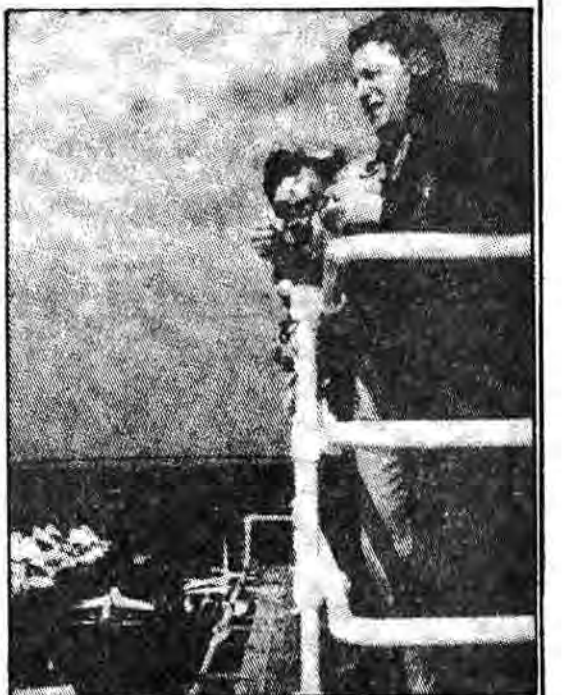
واین برگر وزیر دفاع بر عرشه ناو هواپیمابر کانی

سال ۱۹۸۳ پنتاگون را بررسی خواهد کرد تا جراحی‌های راند را سانس و خریدهای پول دولت را سرعت بدهد. هر دو گروه به دقت لیست خرید برای چین حملاتی هدفی بسیار خوبی نیز وجود دارد. متفکرین ۱۷ خودروه جنگی تویخانه که در داخل یک بودجه جدید رولاند ریگان شامل بخش دوم طرح ۵ ساله ۱۷۷ تریلیون دلاری و سنی‌ها می‌باشد و از ۳۱۵/۹ میلیارد دلار برای نظامی و ۲۵۸ میلیارد دلار در سایر حرجها برای ۱۹۸۳ تشکیل شده است. ولی احتمال زیاد می‌رود که کنگره که سال گذشته نمی‌توانست به اندازه کافی روی امور دفاعی خرج کند یک موضع گیری شدید در برابر کس بودجه و جنگناک بگیرد. و شواهد بسیاری نیز مبنی بر آنالافا و اسرافهای زیاد در امور نظامی و کم کردن بیشتر خدمات اجتماعی در طی یکسال انتخاباتی موجود است. سنانو ویلیام آرمنترانگ که نماینده کلرادو و از حزب جمهوریخواه است می‌گوید: «با تمام آن چیزی که شما از گفتن آن دارم، بودجه دفاعی آمریکا نباید سهم خود را از همین قطع بودجه‌های