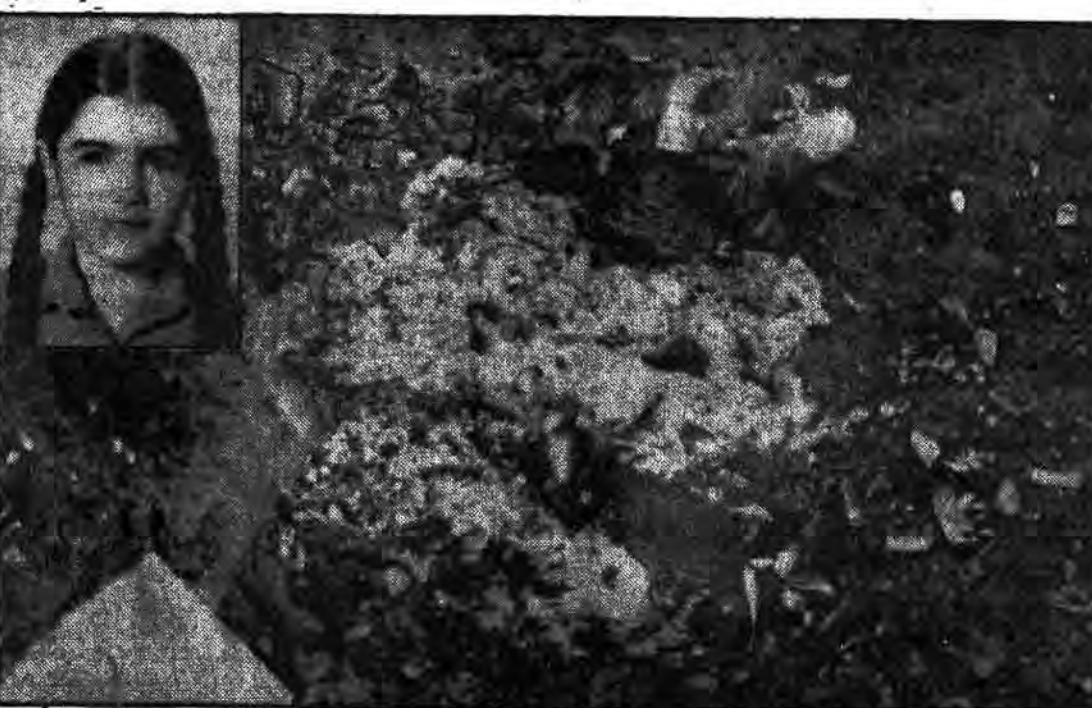
سنگرش خهبان باارمهای خون آلود بدن تکه تکه این نوآموز ۸ ساله پیوسته شده است. بیکی از فرزندان شهیدان کربلا است. در روز ۱۳۵۷ میلادی در جریان جنگ کربلای معلی شهید شد.

اسقف کاپوچی پس از بازدید از اردوگاه چشمته: از اسرای عراقی در ایران به نحو احسن نگهداری می شود در فصله ۲