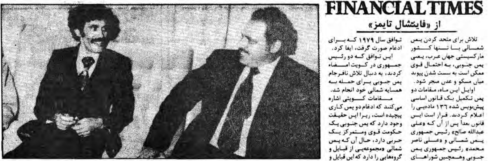
دو رئیس جمهور یمن شمالی و جنوبی

و یمن جنوبی بیش از یک میلیون نفر جمعیت دارد حدود ۸۰۰۰۰۰ سنی شمالی در عربستان سعودی کار می‌کنند و در محافل محافظه کار و هم پدیده‌های دیگری در خاورمیانه دیده می‌شود که وحدت میان یمن شمالی و یمن جنوبی، تغییرات بزرگی را در هر دو یمن ایجاد کرده است. وجود یمن جنوبی به وجود آمدن دولت جدیدی در یمن شمالی منتهی می‌گردد. این تغییرات در یمن شمالی و یمن جنوبی به وجود آمده است. این تغییرات در یمن شمالی و یمن جنوبی به وجود آمده است.