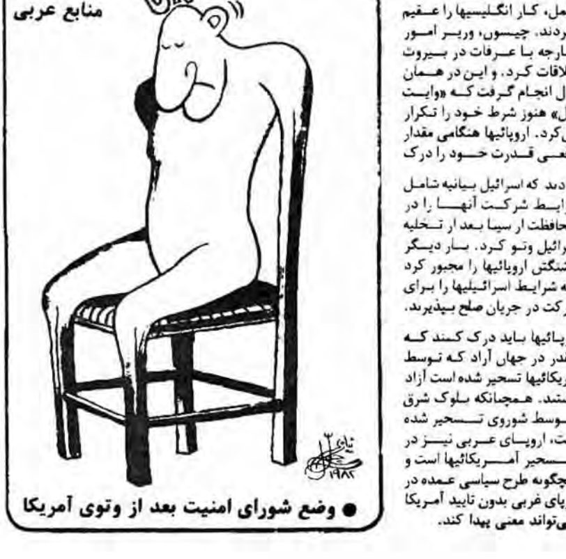
وضع شورای امنیت بعد از وتوی آمریکا

عمل، کار انگلیسیها را عقیم کردند. چیسو، وزیر امور خارجه یا عرفات در بیروت ملاقات کرد. و این در همان حال انجام گرفت که «وایت هال» هنوز شرط خود را تکرار می‌کرد. اروپائیان هنگامی مقدار واقعی قدرت خود را درک کردند که اسرائیل بیانه شامل شرایط شرکت آنها را در تحلیله محافظت از سیاه بعد از تحلیله اسرائیل وتو کرد. مار دیگرو واشنگتن اروپائیان را مجبور کرد که شرایط اسرائیلیها را برای شرکت در جریان صلح بپذیرند. اروپائیان باید درک کنند که جقدر در جهان آزاد که توسط آمریکا تفسیر شده است از آن هستند. همچنانکه سلوک شرق توسط شوری تفسیر شده است، اروپایی‌ها عریبی نیز در تفسیر آمریکا تفسیر شده است و هیچگونه طرح سیاسی عمده در اروپا فریب بدون تأیید آمریکا نمی‌تواند معنی پیدا کند.