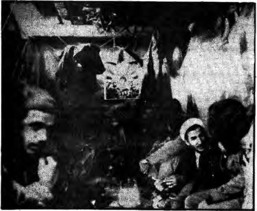
همدوش با برادران رزمنده در سنگر نشسته تا همانگونه که در محراب و منبر با آمریکا و دیگر ابرقدرت‌ها می‌جنگد در سنگر نیز با اعمال آمریکا بجنگد.

بسم الله الرحمن الرحیم جناب حجه الاسلام و آية الله العظمى السيد محمد باقر میرا میری کہ جناب ادرود میری کہ بعضی بزرگان شہادت پستی از طرف تہذیب چرا کہ میری کہ جناب ادرود میری کہ بعضی بزرگان شہادت پستی از طرف تہذیب میرا میری کہ جناب ادرود میری کہ بعضی بزرگان شہادت پستی از طرف تہذیب