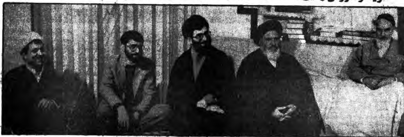
رؤسای قوای سه گانه در حضور امام

● باید تقدیر کنیم از قوای مسلح و مردمی که با قدرت پیشروی می کنند ● فتح ما آنوقتی است که کشورهای اسلامی بدون سلطه قدرتمندان زندگی کنند ● تا مردم در صحنه حاضرند این کشور آسیب نخواهد دید. درفصله ۱۲