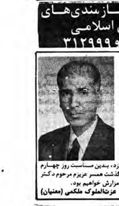
مهندس بزرگوار در حال است که در واقع مرگ جانسون کوپن میگذرد و برای آمینت روح استغفار بر این معصیت و تقاضای عفو و رحمت الهی است.

اصفهان- عملیات ساختمانی دبستان به کلاسه روستای سرنگ ایلد به دره شهر پانفت و مسورد بهربردی قرار گرفت.