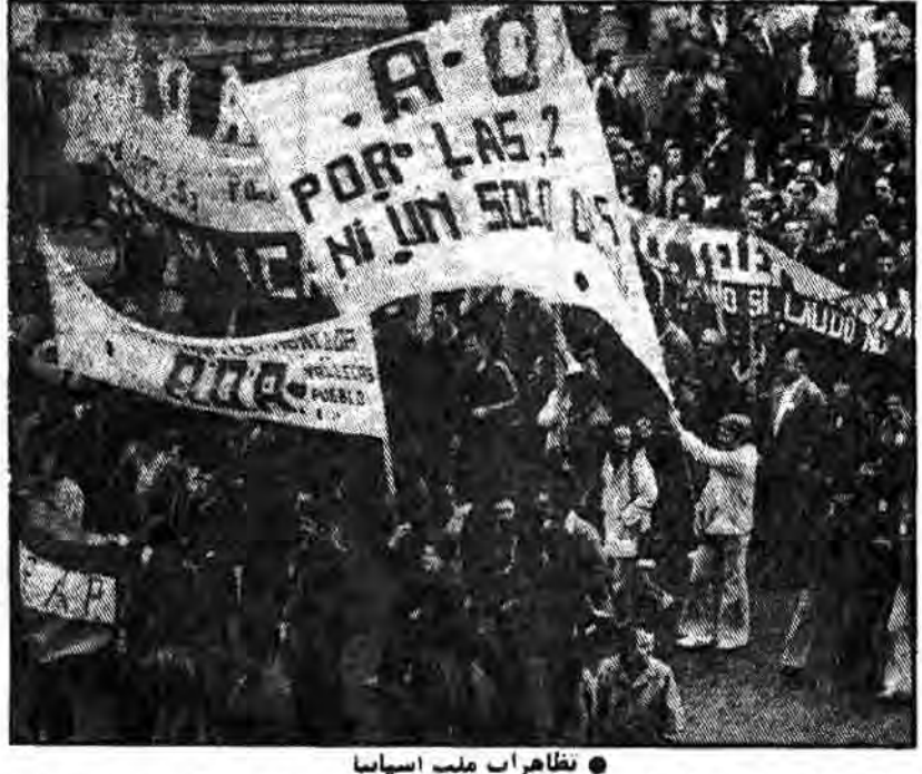
نظارت ملت اسپانیا

در پی موافقت پارلمان اسپانیا جهت ارائه درخواستی سنی بر پیوستن این کشور به پیمان آتلانتیک غیرعادی است. این موافقت نهایی کنگره آمریکا و پارلمانی دیگر کشورهای عضو، این پیمان داد، در اینجا سنی‌ها که مطرح می‌شود این است: چرا دولت اسپانیا تمایل به پیوستن به پیمان آتلانتیک پیدا کرد؟ قبل از اینکه به این سؤال پاسخ دهیم باید گفت پیمان موافقتنامه‌ایکه در سال ۱۹۵۳ در شمال فرانکو به امضاء رساند، اکنون باگانهایی نظامی آمریکا در اسپانیا وجود دارند، این موافقتنامه در جهت پایای دادن به اروائی که اسپانیا چه از سوی ما و چه از سوی ایالات متحده با آن روبرو بود منعقد گردید. در پی این قرار داد ظاهر از سوی ایالات متحده کمکهای اقتصادی به اسپانیا داده شده است. این موافقتنامه همچنان ادامه داشت تا اینکه دولت اسپانیا در سال ۱۹۷۷ توسط آثرا به چند علت به تصویب این موافقتنامه منتهی شد که مهمترین آنها بدینترتیب است: اسپانیا مایل بود پیمان آتلانتیک را بپذیرد تا از این طریق بتواند به خواسته‌های بیشتر و جدیدتری از ایالات متحده همچون همپیمان جدیدی با آن کشور دست یابد. دلیل دیگر آنست که اسپانیا خواهان استفاده از طریق نیروهای مسلح خود را از تخصص بیشتری برخوردار سازند اینها دلیلی است که اسپانیا را واداشت تا تصدیق موافقتنامه حضور نیروهای آمریکائی در این کشور را بقبولد. یک نظر اجمالی برخواستی که اسپانیا پس از درگذشت فرانکو بخود دید و در این حوادث افسران عالی‌رتبه نظامی به امور سیاسی اسپانیا سرگرم شدند دلایل واقعی مهمی را که دولت اسپانیا را وادار ساخت تا برای پیوستن به پیمان آتلانتیک اهمیت دهد روشن می‌گردد. این دولت از این طریق می‌خواست تا با عضویت در این پیمان با افسران عالی‌رتبه رابه مسائل دیگری متوجه مسائل مهم