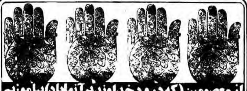
از معصومین (که درود خداوند بر آنها باد) پیام‌آوریم

بعد از رنسانس و شکوفایی تمدن غرب، در اسلام شناسی یک مرحله تازه آغاز گردید و «مسیونر اسلام ستیز» جای پادگیری فرهنگ اسلامی، در واقع اسلام ستیزی فرهنگ سلطه جهان بوده و همانگونه که در سالهای اخیر همل مختلف به اقتباس فرهنگ اروپائی و امریکائی پرداختند، در آلمان اقوام و ملل مختلف به اسلام روی آورده بودند. مسیحیان اروپا این نکته را در کم میکردند که در فلسفه و طب و ریاضی و علوم مختلف و در تکنولوژی مسلمانان بسی پیشرفته‌تر از آنانند. نتیجتاً آنها درصدد پید گرفتن این علوم از مسلمانان برآمدند.