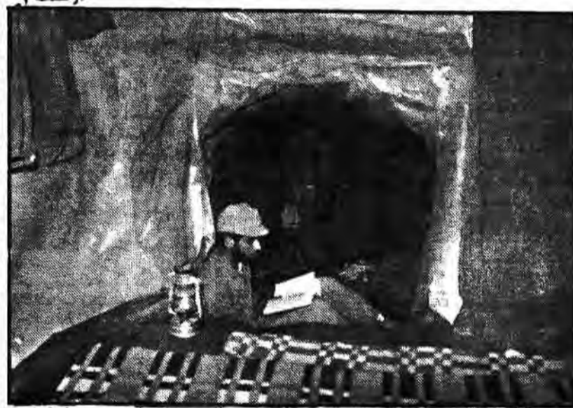
● هنگام فراغت رازونباز با خدا و پرداختن به ادعیه خوانی جزو فراموشی رزمندگان اسلام است آنها که پارسایان، وز و عابدان شنبید وار تباط آنها با خداست که توانندی آنها را مضائق می‌کند و نیروی می‌گیرند تا متجاوزین به میهن اسلامی را بر آن طرف مرزها برانند تصویر فوق نمونه‌ای است از هزاران صحنه اینچنین

دژخیمان صدام ۱۶۸ تن از مسلمانان عراق را اعدام کردند