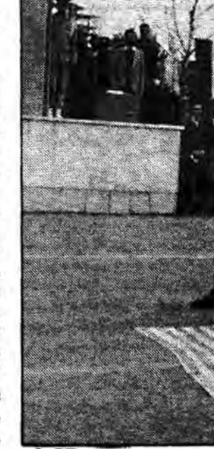
بزرگاری نماز جمعه در زمین