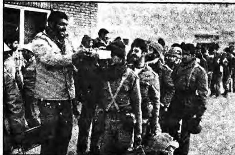
برای فتح کربلا پیش به سوی جبهه‌ها