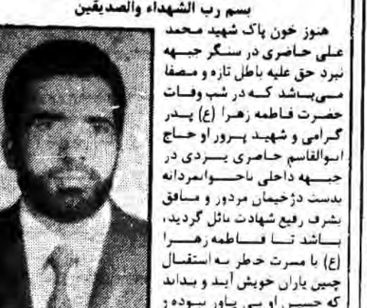
بسم رب الشهداء والصدیقین