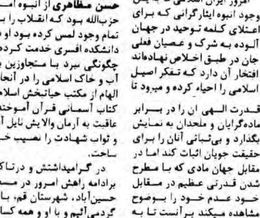
بسم رب الشهداء والصدیقین