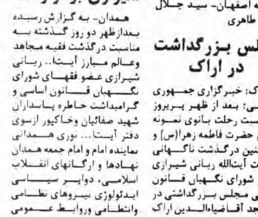
بسم رب الشهداء والصدیقین