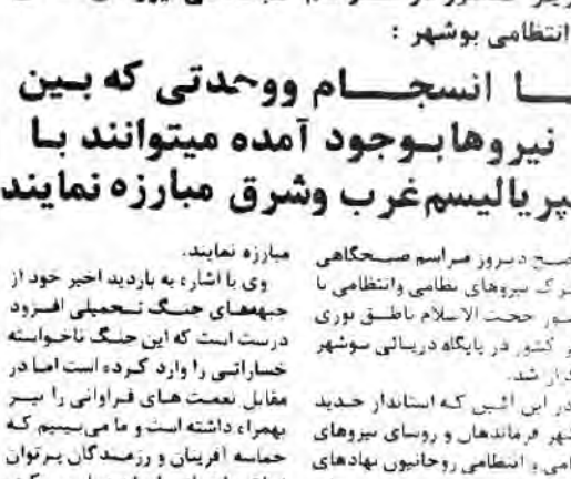
بسم رب الشهداء والصدیقین