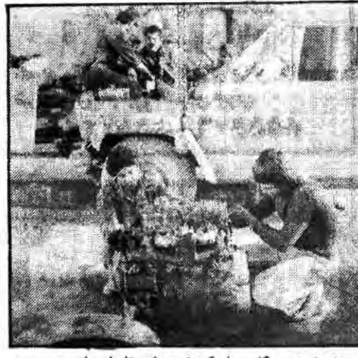
نمونه ای از تعمیرگاه سیار که توسط ستاد امداد در پست جبهه تشکیل شده است