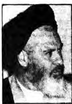
آقای موسوی اردبیلی رئیس دیوانعالی کشور...