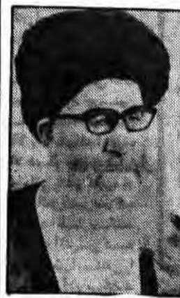
بسم الله الرحمن الرحيم حالات وحشیانه رژیم اشغالگر صهیونیسم به کشور لبنان وارد شده و از تهاجمات صهیونیسم و آمریکا برداشته و نشان داد که چگونه حقوق بشر پایمال میسازد...