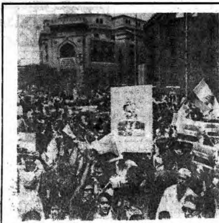
فاره - امت مسلمان مصر بیاز برگزاری نماز جمعه در شهر فاره تظاهرات وسیعی علیه آمریکا و رژیم افکارگرسین بغاوت تجاوز به خاک لبنان برپا میدارند.

یکشنبه ۳۰ خرداد ۱۳۶۱ شعبان ۱۴۰۲ - شماره ۸۸ - سال چهارم شماره ۲۷