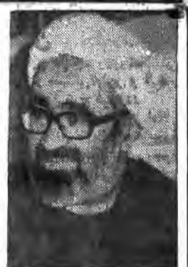
شروع این مسافرتی (هیتها) در ماه مبارک رمضان و در آستانه روز قدس که یک روز جهان مسلمین است بهترین وقت خواهد بود

آیت‌الله العظمی منتظری در ملاقات با نخست‌وزیر: