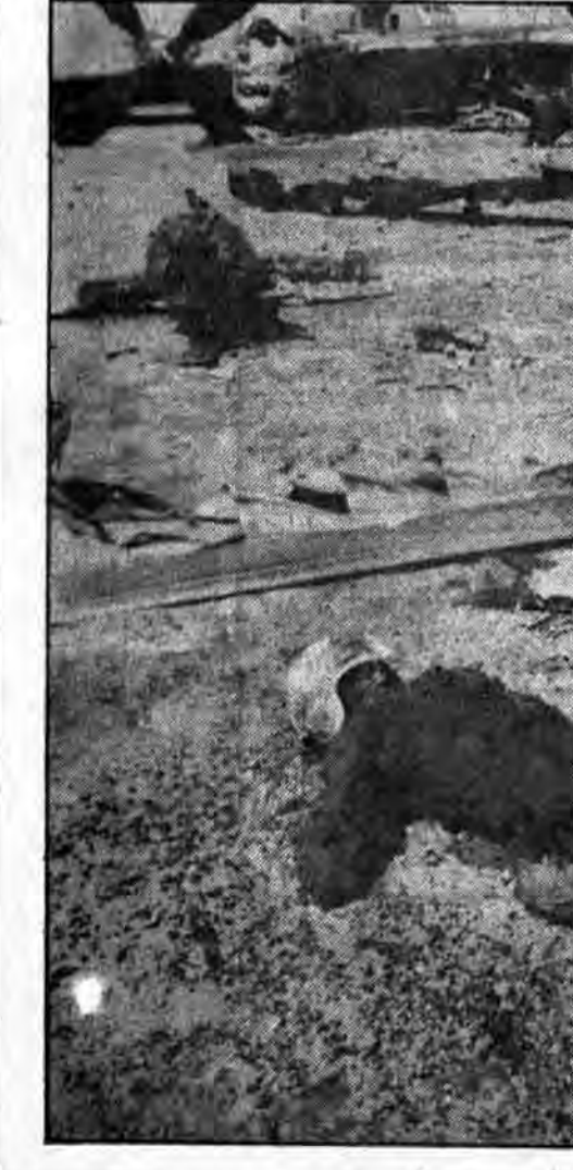
علاقه اش به آزاد سازی گروگانها مجازات و تنبیه نموده ولی متأسفانه اقدامات آزاد سازی گروگانها موفقیت آمیز نگردید تا بالاخره لانه فساد و جاسوسی به تسخیر جوانان افلاکی و مسلمان درآمد.

شخصاً من هیچ گونه تاسف و پشیمانی اخلاقی به سیاسی از شکست عملیات ندارم. من فکر می کنم که مایوسان همه بودیم تا در بهترین وقت افرادمان را در سفارت رهاسازییم. در آن زمان منظر می رسید که راه حل های ثانوی یا میبایستی در جس بودن آنان باشد و یا کشتن آنان بدست ایرانیها. بزرگترین نگرانی من همانا امکان بدست نیامدن موقعیت غانگنیرانه و محرمانه ماندن نقشه عملیات بود. من هیچگاه خواب آن را هم نمی دیدم که بعلت های قس و تکنولوژی که آمریکا بسیار در آن پیشرفته میباشد ما شکست بخوریم. من عیبناستم که این کار خطراتی در برداشت کاصولاً اجتناب پذیر بود. من احساس می کردم که اگر امکاناً نیز این احساس را دارم که سراز زدن از عملیاتی که ما قادر به انجام آن بودیم بسیار ترسناک و سختبار بود.