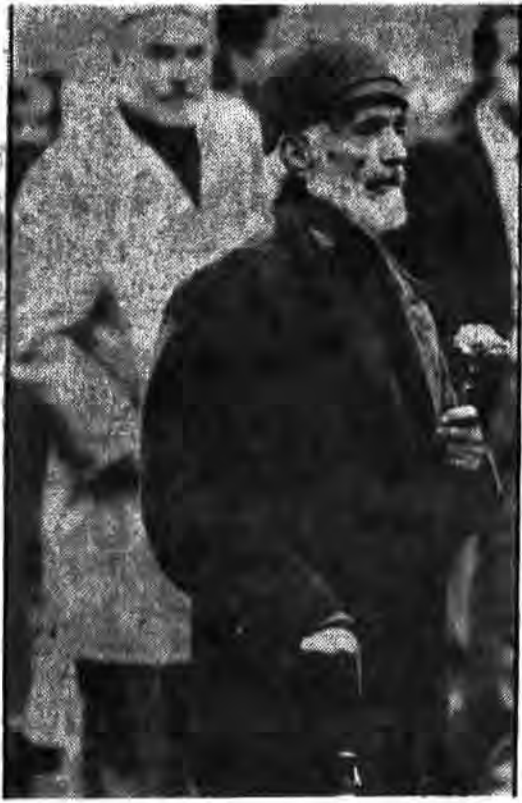
نثار جان خویش و این خودمایت انقلاب اسلامی را بیشتر پیش کشیدین می‌سازد.

شده است . * استقلال اقتصادی و رسیدن به یک رفاه نسبی و اسلامی که از جمله اهداف انقلاب اسلامی است از دید بخشی از مردم بعنوان یک ضرورت مهم تلقی شده است و در این رابطه عوامل مختلفی همچون «کوشی و جدت بیشتر در تولید و انجام مسؤلیت‌های شخصی، و سازندگی و تولید» و ... که مجموعاً رقی ممال ۷۳٪ را بخود اختصاص می‌دهد. * یاری کردن دولت اسلامی که مورد تأیید مردم می‌باشد نیز خود در این مقطع از انقلاب بعنوان ضرورتی مهم تلقی گشته و از سوی بیش از ۷۰٪ مردم در رابطه با پاسخ سؤال مربوطه عنوان گشته است و با این پاسخ خود را آماده و گوش بر فرمان و در اختیار دولت قرار می‌دهند، تا با فرمان این رکن نظام عمل نمایند. بهرحال آنچه در کل میتوان اظهار داشت ، صرف‌نظر از شدت و ضعف مسؤلیت پذیری در قبال روند انقلاب ، غیر از درصد ناچیزی (حدود ۳٪) اکثریت قریب به اتفاق مردم خود را ملزم به حرارت از دستاوردهای انقلاب اسلامی دانسته و بدستاء طریق و در حد توانائی و با تقریب وجودی خود، خواهان امداد و یاری نمودن ارکان نشانیه چه با کوشی در جهت حفظ وحدت و یابارزه با ضد انقلاب ویا در حد