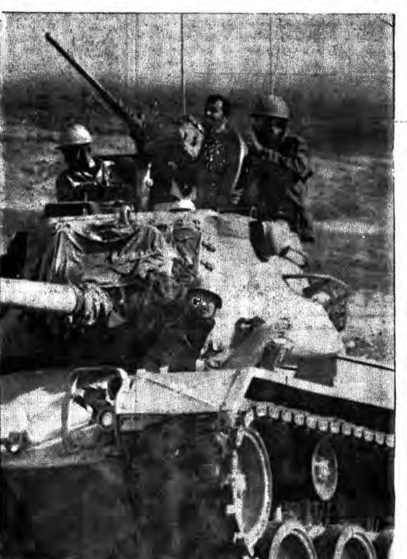
برای فتح کر بلا پیش بسوی جبهه ها

۲۹ تن دیگر از هموطنان آبادانی شهید و مجروح شدند دشمن از شرق فکه به ارتفاعات منطقه گزیخت ۹ تانک و خودروی دشمن در منطقه میبک منهدم شد هوایمهای عراقی بار دیگر به حریم شهر ایلام تجاوز کردند در صفحه ۲