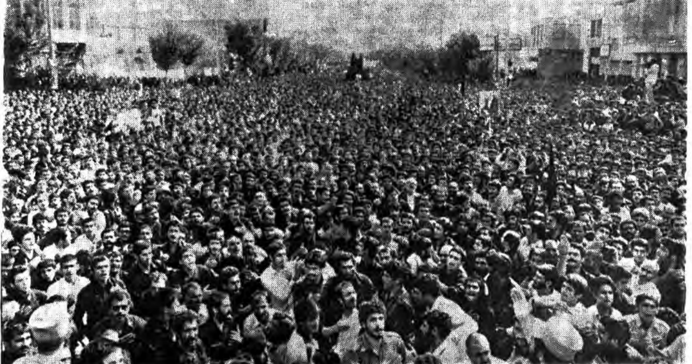
مردم قهرمان پرور شهرستان یزد برای آخرین بار مرد محراب خود را مشایعت می کنند و با پیکر مطهر بخون آرمیده اش میثاق می بندند تا منتقم خویش باشند و تداوم بخش راهش

۱۲ صفحه جمهوری اسلامی یکشنبه ۱۳ تیر ۱۳۶۱ ۱۲ رمضان ۱۴۰۲ - شماره ۸۹۵ - سال چهارم شماره ۲۲