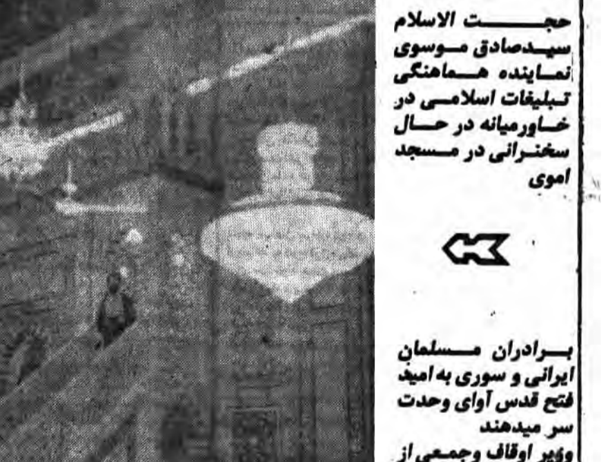
برادران ایرانی و سوری به امید فتح قدس آوای وحدت سر میدهند

حجست الاسلام سید صادق موسوی نماینده هماهنگی تبلیقات اسلامی در خاورمیانه در حال سخنرانی در مسجد اموی