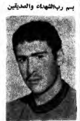
بسم رب الشهداء والصدیقین

مجلس بزرگداشت سومین شهید محراب امروز بر گزار می شود بقیه در صفحه ۱۲