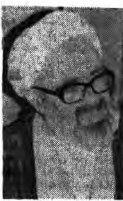
در صفحه ۶

● از اهم وظایف هیئتهای اعزامی بسیج مسلمانان برای شرکت در تظاهرات روز قدس است