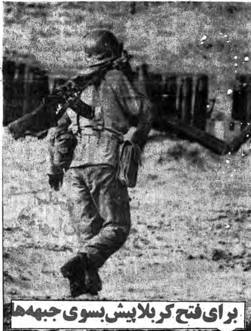
برای فتح کربلا پیش بسوی جبهه ها

تولیز یون آلمان: اسرای عراقی در ایران آرزوی برقراری جمهوری اسلامی در عراق را دارند