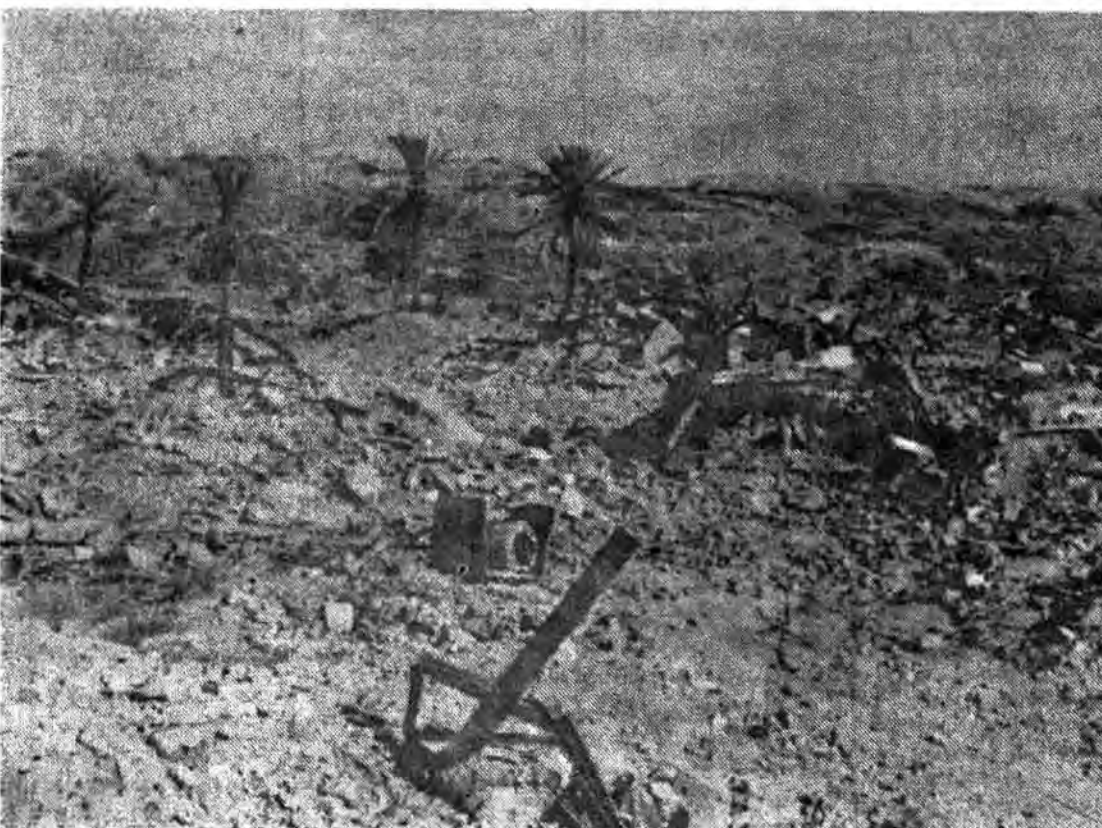
ایستادگان و تیر و تیروری حق بر طاعت ویران شده و بیچاره شهیدان در مقابل شاه با مشت ایستادند و همانگونه که در مقابل صدام با ایثار جان ایستادند و در این زمان نیز با جان و قلم و بیان در مقابل ابرجانبکاران خواهند ایستاد که الصبح بین اسلام و کفر معنی ندارد.

بسیار باقی مانده و حیوانات در حالیکه دشمن آن کشی دیگر خود را به شکست های بی در پی کشند. میروند تا عراق را از لوث وجود کنار بکنی آزاد نمایند