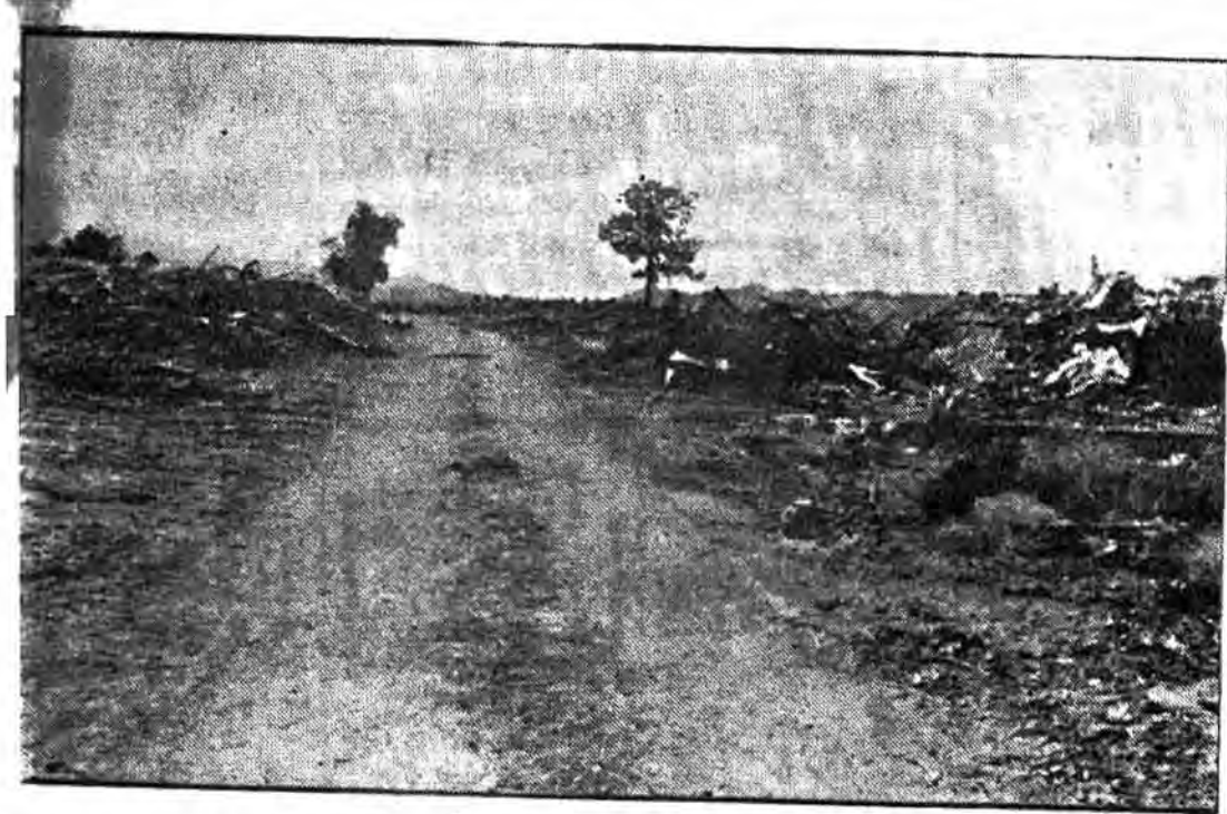
ایستادگان قهر قهر شیرین زیا را نظاره کنید بیسید صدامیان چگونه از آن محافل فرار کرده اند.

بناظر زنده کرد. در آن زمان وقتی مردم با مشت های گره کرده در مقابل ناسکها و سلس های شاه آمریکائی شعار می دادند و با گلوله های بی پایان نزدوران آمریکائی می شدند. فرید می زدند «توب» تا تلفات مسلسل دیگران نماند و حالا پس از سه و چند ماه همان جوانان در حالیکه دشمن آن کشی دیگر خود را به شکست های بی در پی کشند. میروند تا عراق را از لوث وجود کنار بکنی آزاد نمایند