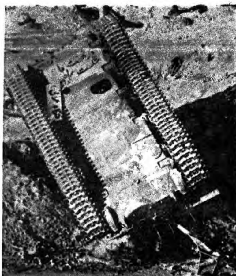
برای فتح کر بلا پیش بسوی جبهه‌ها

در این عملیات بیش از ۲۱۰۰ تن از نیروهای دشمن کشته و زخمی شدند و به لشکرهای ۳، ۹، ۱۰ و ۵ عراق خسارات فراوانی وارد آمد.