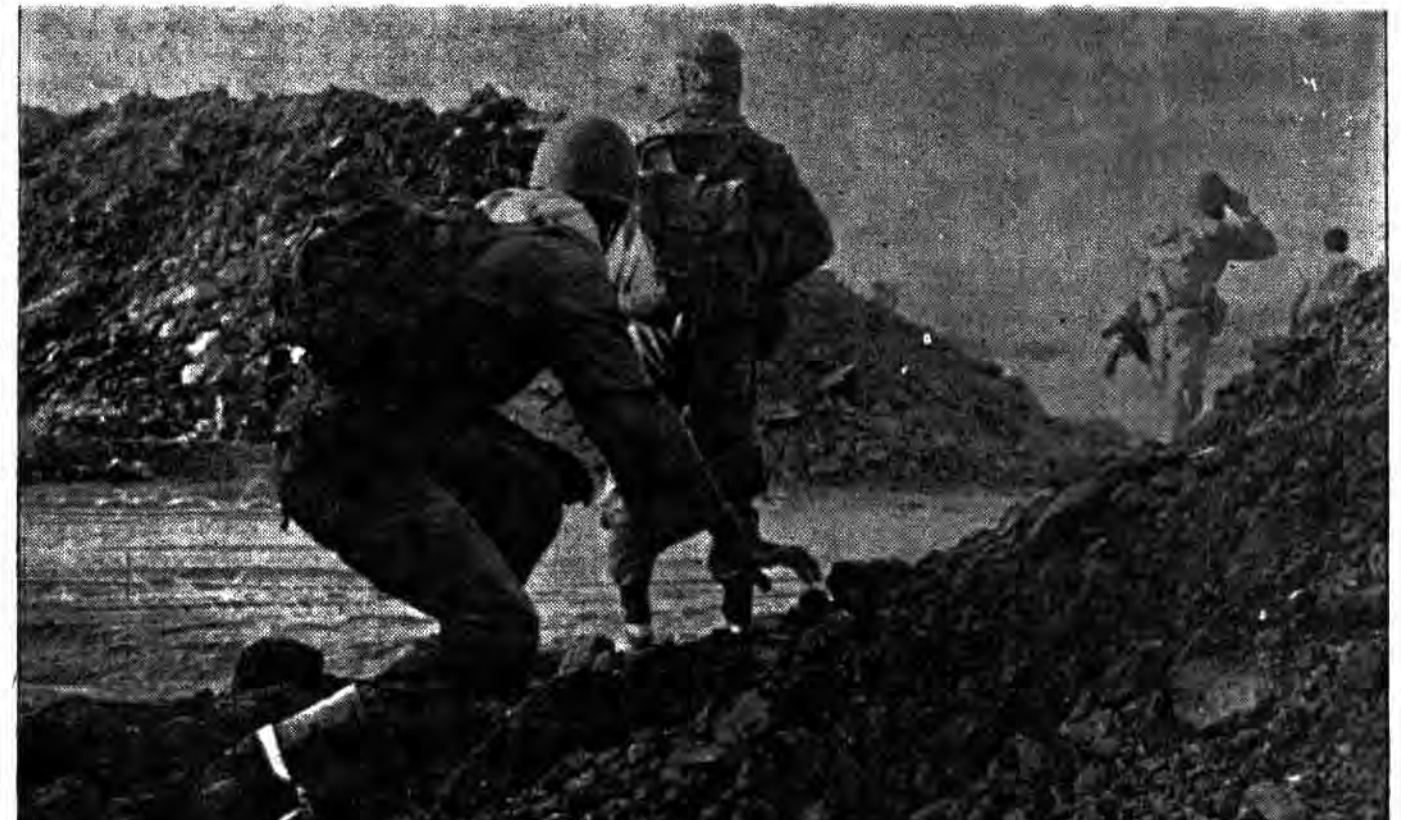
این خروش مردان خداست، دیگر جنود شیطان را قدرت مقابله با آن نیست «چه» کفر را سزای استادن در مقابل فریاد الله اکبر ذلت است. عکس رزم آوران اسلام را در حال ریزش در مواضع دشمن زبون نشان میدهد

صدام خواهان گسترش روابط علنی با آمریکا شد