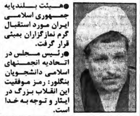
هیئت بلندپایه جمهوری اسلامی ایران مورد استقبال گرم نمازگزاران بمبئی قرار گرفت. رئیس مجلس در اتحادیه انجمنهای اسلامی دانشجویان بنگلور: رمز موفقیت این انقلاب بزرگ در ایثار و توجه به خدا است.

بدعوت دولت هند: حجت الاسلام رفسنجانی و هیئت همراه در مراسم ویژه روز استقلال هند شرکت کردند