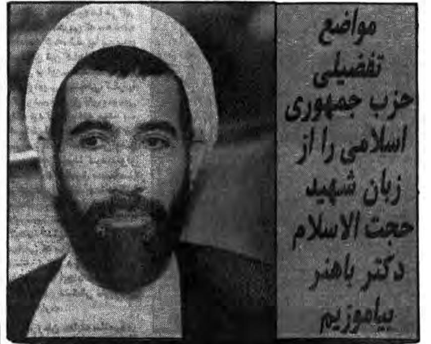
مواضع تفصیلی حزب جمهوری اسلامی را از زبان شهید حجت الاسلام دکتر باهنر بیاموزیم