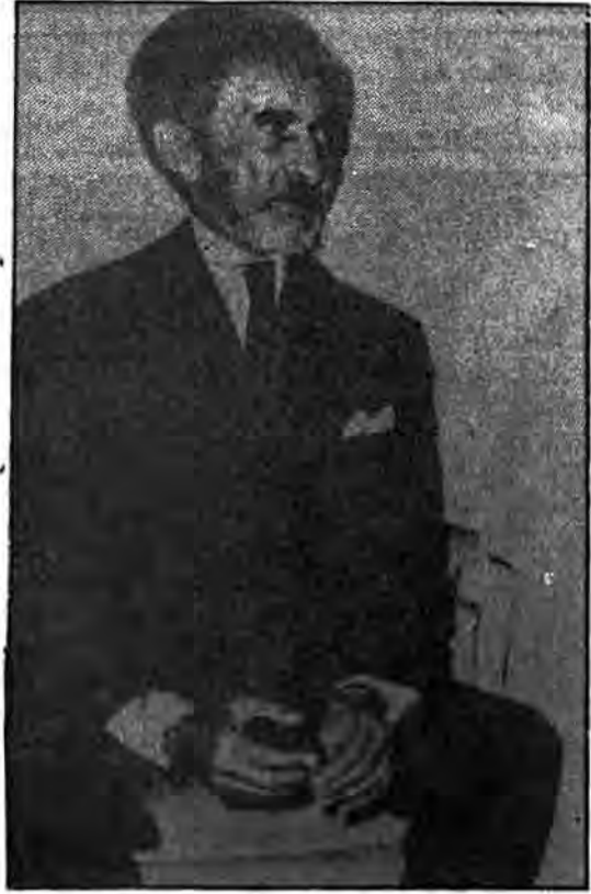
دوایله سلاسی در طول حکومت دولتی و طاقوتی خود سهم بزرگی در مبارزه با مسلمانان «ارومو»یی داشت.

در زمان «دوایله سلاسی»، جانشین «منلیک» که از سال ۱۹۱۶ تا ۱۹۷۴ بر تخت سلطنت «امهارا»یی حکومت کرد، آزادی ملت «ارومو» و نابودی فرهنگ آنها با اراده بیشتر ادامه یافت. هزاران «ارومو» از سرزمین خود جابه‌جا شدند و تعطیلات «امهارا»یی کردن و مسیحی کردن تشدید گردید. همه آموزش و فرهنگ امروزی در اتیوپی اکنون به زبانی «امهارا»یی است و آموزش عربی در مدارس مسلمانان «ارومو»یی ممنوع است. با سرنگونی «دوایله سلاسی» در سال ۱۹۷۴ تمامی حقوق مسلمانان «ارومو» از بین رفت. از آن زمان «دوایله سلاسی» برای اسکان «امهارا»یی‌ها در سرزمین مسلمانان «ارومو» به کار رفته است. هر کس که در کشور مسلمان به رسمیت شناخته می‌شود، باید برای اسکان «امهارا»یی‌ها در سرزمین مسلمانان «ارومو» به کار رفته است. هر کس که در کشور مسلمان به رسمیت شناخته می‌شود، باید برای اسکان «امهارا»یی‌ها در سرزمین مسلمانان «ارومو» به کار رفته است.