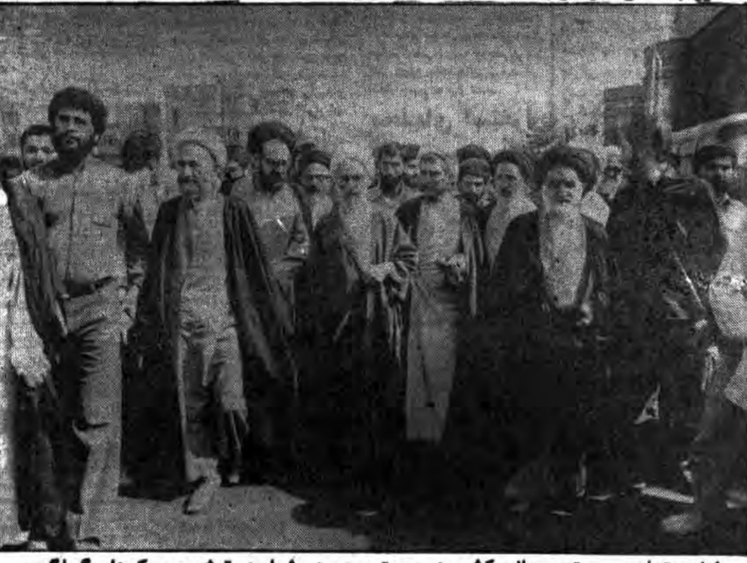
شخصیتهای برجسته روحانی کشور در معیت مردم هوشیار در تشییع پیکرهای گلگون شهدای جنایت هولناک منافقین شرکت نمودند

استخدام رسمی پزشک در ژاندارمری جمهوری اسلامی ایران شرح در صفحه ۱۱