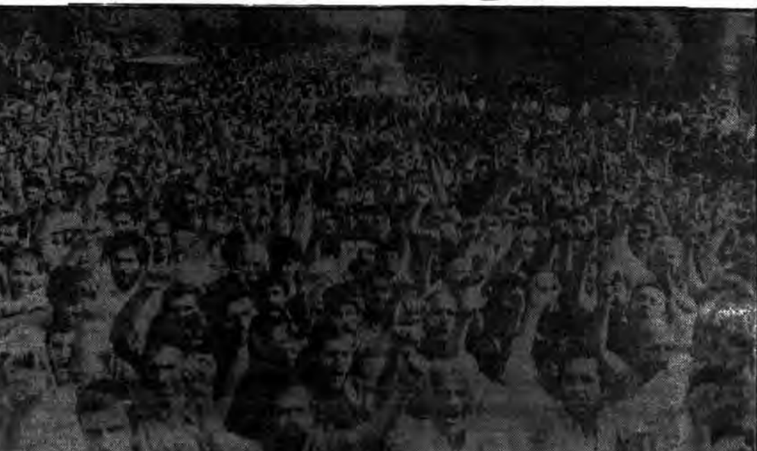
صدها هزار نفر از امت حزب‌الله همیشه در صحنه با مشت گره‌کرده یکبارچه و متحد همچون آن زمان که طاعوت بزرگ را سرنگون کردند اینک برآند تا طاغوت‌ها را که نور چشمان ابرقدرت‌هایند به زباله‌دان تاریخ بیفکنند و این مسئله دیری نخواهد پایید