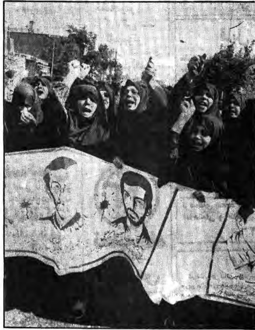
تخلیل از مقام والای شهدای کمیته انقلاب اسلامی مراتب تفرغ و انجاز خود از اعمال جنایتبار منافقین را ابراز داشتند.