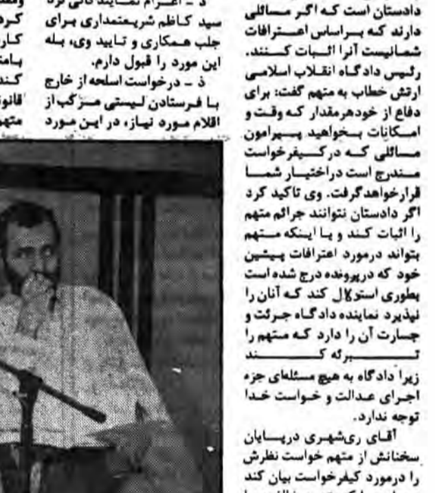
مجلس بزرگداشت یاد سه شهید