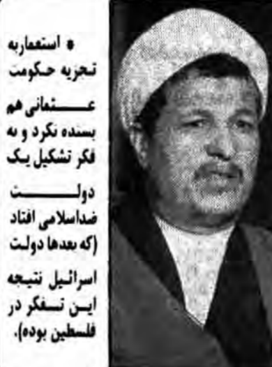
استعاره تجریه حکومت