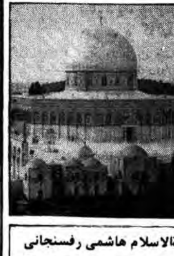
نوشته: حج‌الاسلام هاشمی رفسنجانی