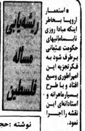
ریشه‌یابی ساله فلسطین