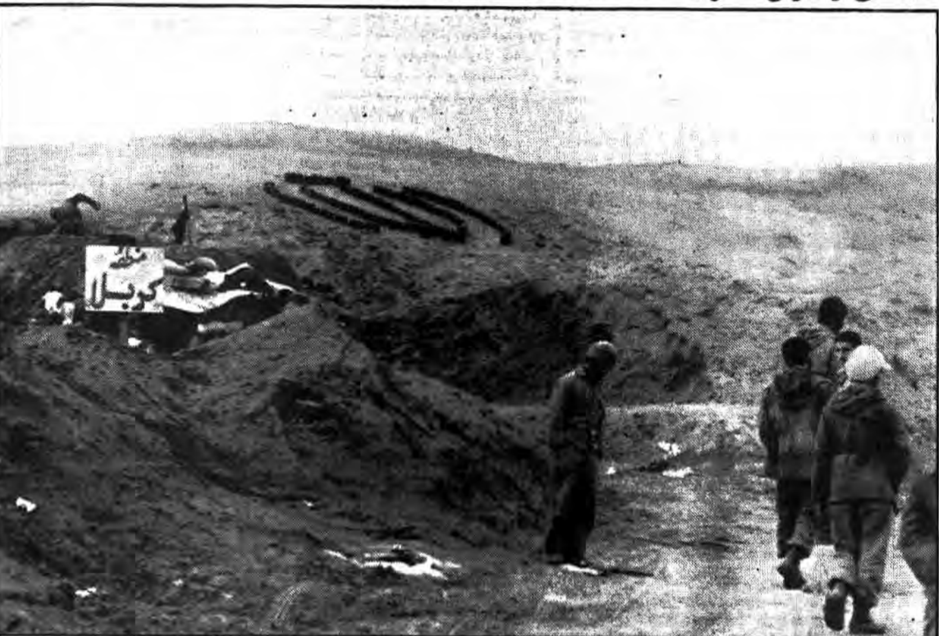
تاچندی پیش این مناطق جولانگاه مشتکی کافر بعثی بود که زمین از وجودشان شرم داشت ولی اکنون بر هر وجب این خاک مردانی قدم نهاده اند که ملائک به وجودشان افتخار می کنند

یکی از سران حزب منحل دموکرات بهلاکت رسید