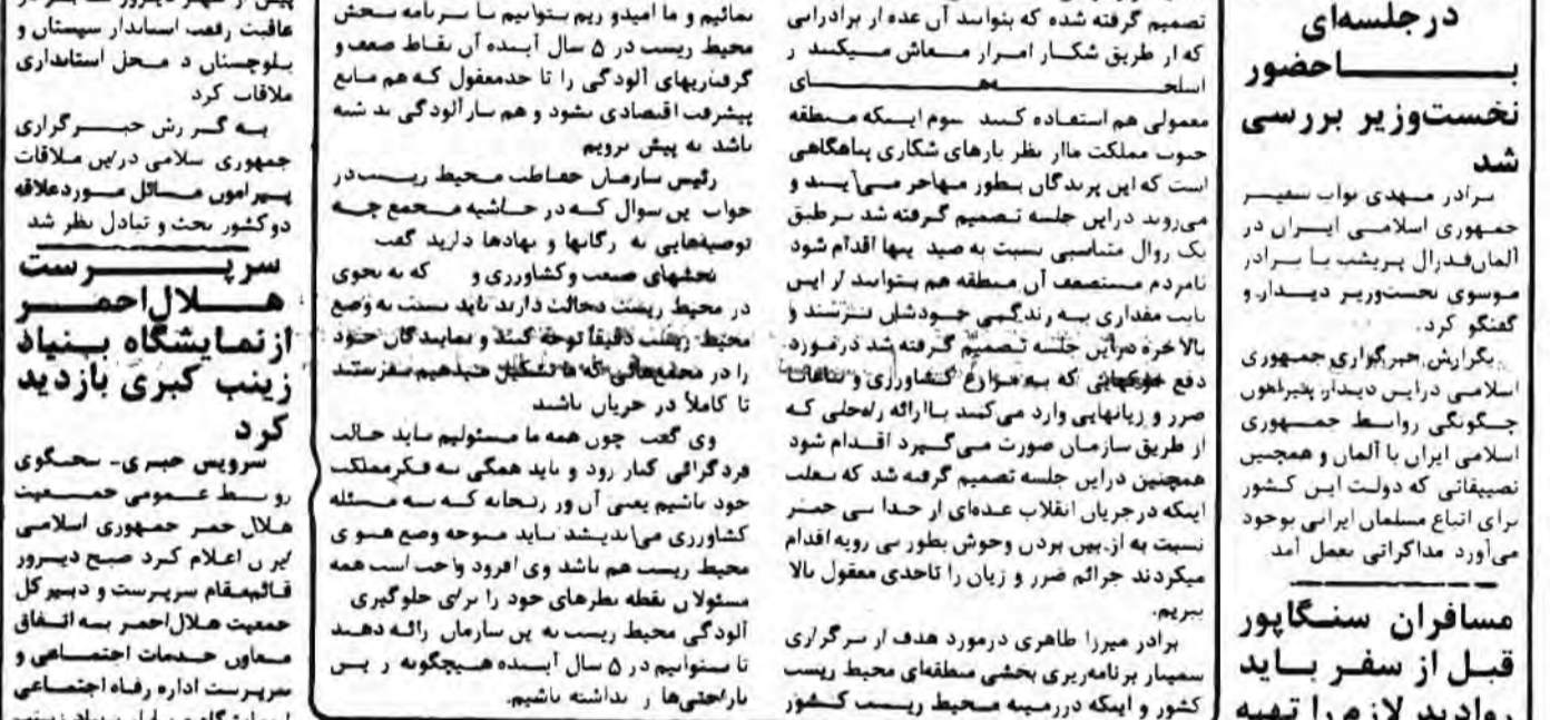
دیدار با امام حجت الاسلام والمسلمین سید علی خامنه‌ای رئیس جمهوری روح پرور به حضور امام خمینی رهبر انقلاب و ستاد مبارزه با دشمنان ...