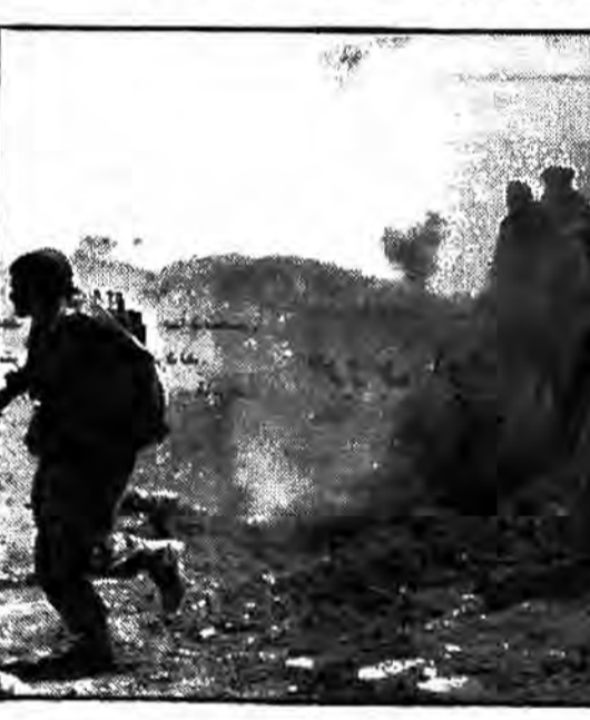
عملیاتی مجبور برادر شدند دشمن بزرگ دادگاه حمایت خود طی ۲۴ ساعت روز دوشنبه...