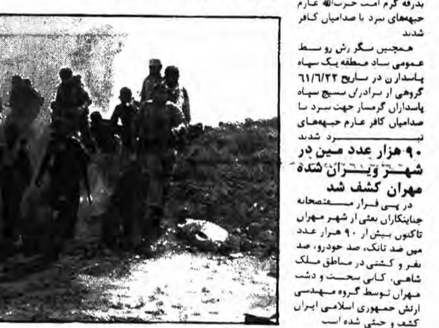
مردم سقز در دفاع به شهیدان رسیدند و تعدادی از روستاها را محاصره کردند...