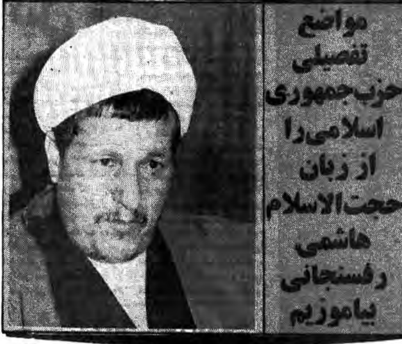
مواضع ما تفصیلی حزب جمهوری اسلامی را از زبان حجت الاسلام هاشمی رفسنجانی بیاموزیم

روح هم دارد ولی بعضی از موجودات، نفعه بسیار ضعیفی از حیات روح را دارند