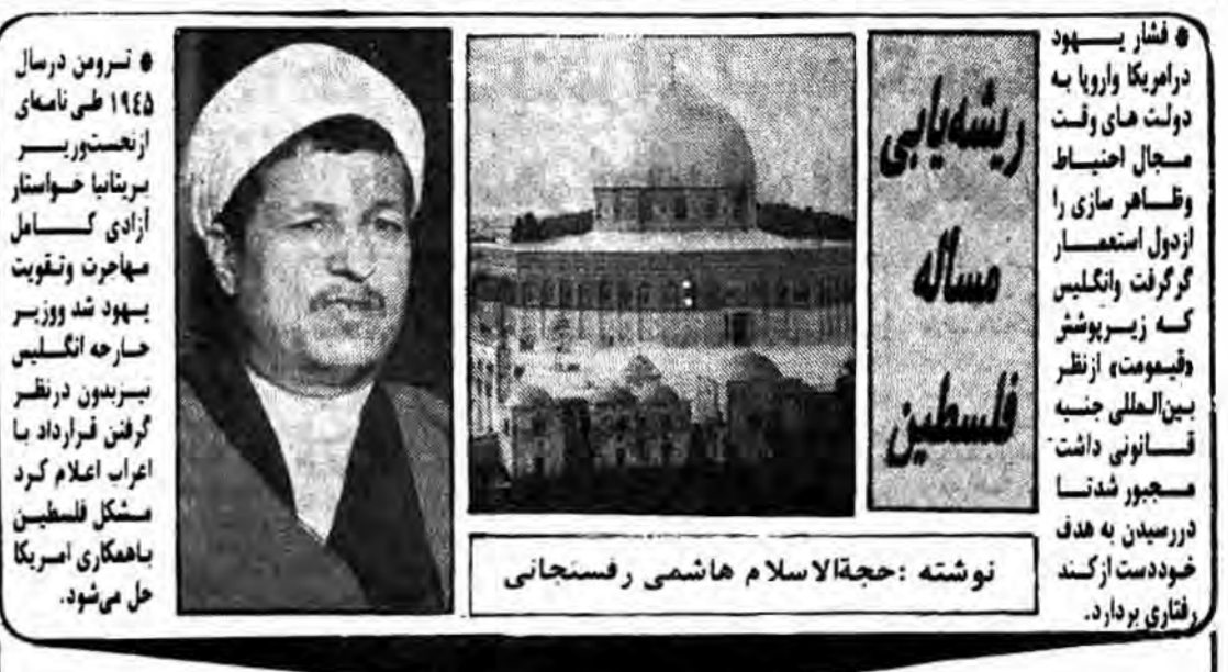
نوشته: حجت‌الاسلام هاشمی رفسنجانی

وزارت بازرگانی آمریکا اجازه فروش ۶ فروند هواپیمای جت را به رژیم عراق اعلام کرد