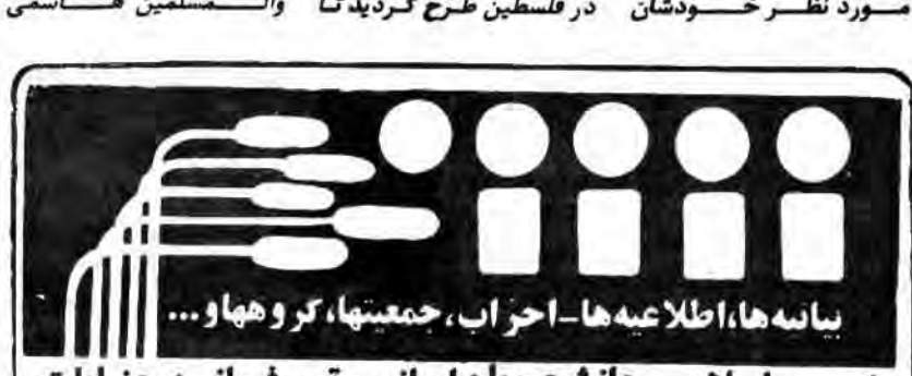
سیس حججه اسلامی والمسلمین هاشمی