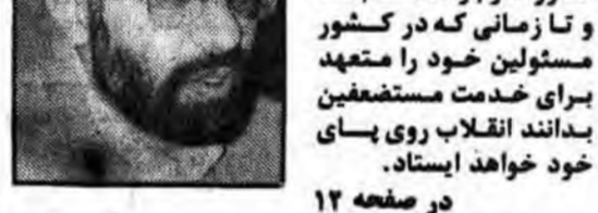
وزیر امور خارجه نکات تازماری را در مورد تشکیل کنفرانس غیرمتمهدها در بغداد فاش ساخت

نخست وزیر: در کشور ماملت است که حکومت میکند