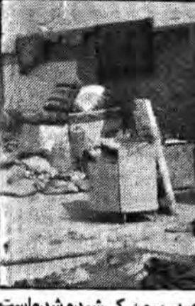
نمونه‌هایی از لوازم و اسباب زندگی که از داخل گل و لای بیرون کشیده شده‌است.

که بکام آوارگان و سبیلزگان آن منطقه رفته بودیم. باتوجه به موضعی که شهرداری تهران در برخورد با مسئله سبیل از خود نشان داده است، تسفیر شهرداری تهران از سوی وزارت کشور یک اقدام مؤثر و سازنده در جهت فصال کردن شهرداری بنظر می‌رسد. ما میدانیم اکثریت کارکنان و کارمندان و ساموران شهرداری دلسوز و مستمند هستند ولیکن تازمانیکه