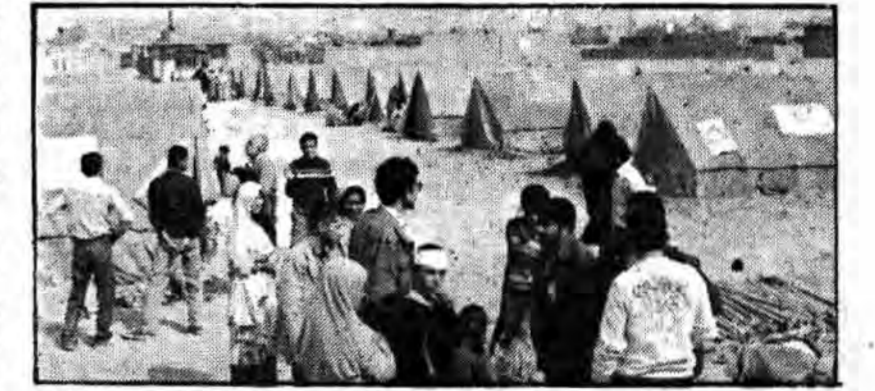
در چند روز گذشته صداهای جادار صحرایی توسط هلال احمر برای سبیلزگان برپا شده است.

عموما در اظهارات خود شهرداری را مقصر میدانند و میگویند بیشتر کارهایی که وظیفه بدیهی شهرداری است اکنون توسط بسیج و جهاد سازندگی و جمعیت هلال احمر محل انجام میگردد. منطقه‌ای بوسعت ۵۰۰ متر