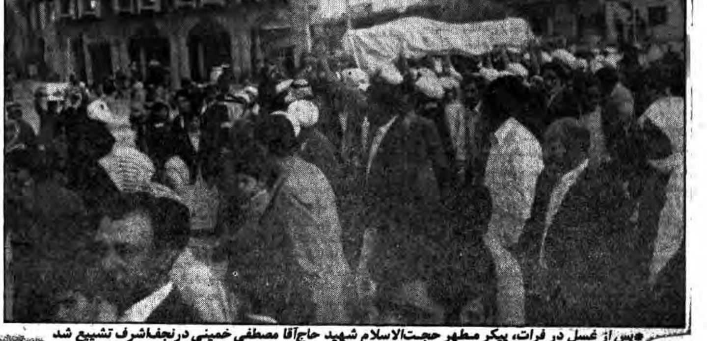
پس از غسل در فرات، پیکر مطهر حجت‌الاسلام شهید حاج آقا مصطفی خمینی در نجف اشرف تشییع شد