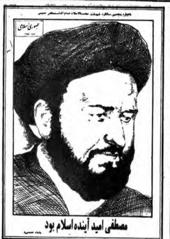
مصطفی امید آینده اسلام بود

● درخواست داتر بر اخراج رژیم صهیونیستی از کنفرانسهای آتی اتحادیه بین المللی ارتباطات راه دور - دوروز با آرای ۶۱ در مقابل ۵۷ رد شد ● درخواست با همکاری ایران و الجزایر مطرح شده بود. به گزارش خبرگزاری فرانسه این رای گیری علیرغم درخواست هیئت الجزایری داتر بر تعیین زمانی طولانی تر برای یافتن توافق بر سر این موضوع انجام پذیرفت. در صفحه ۳