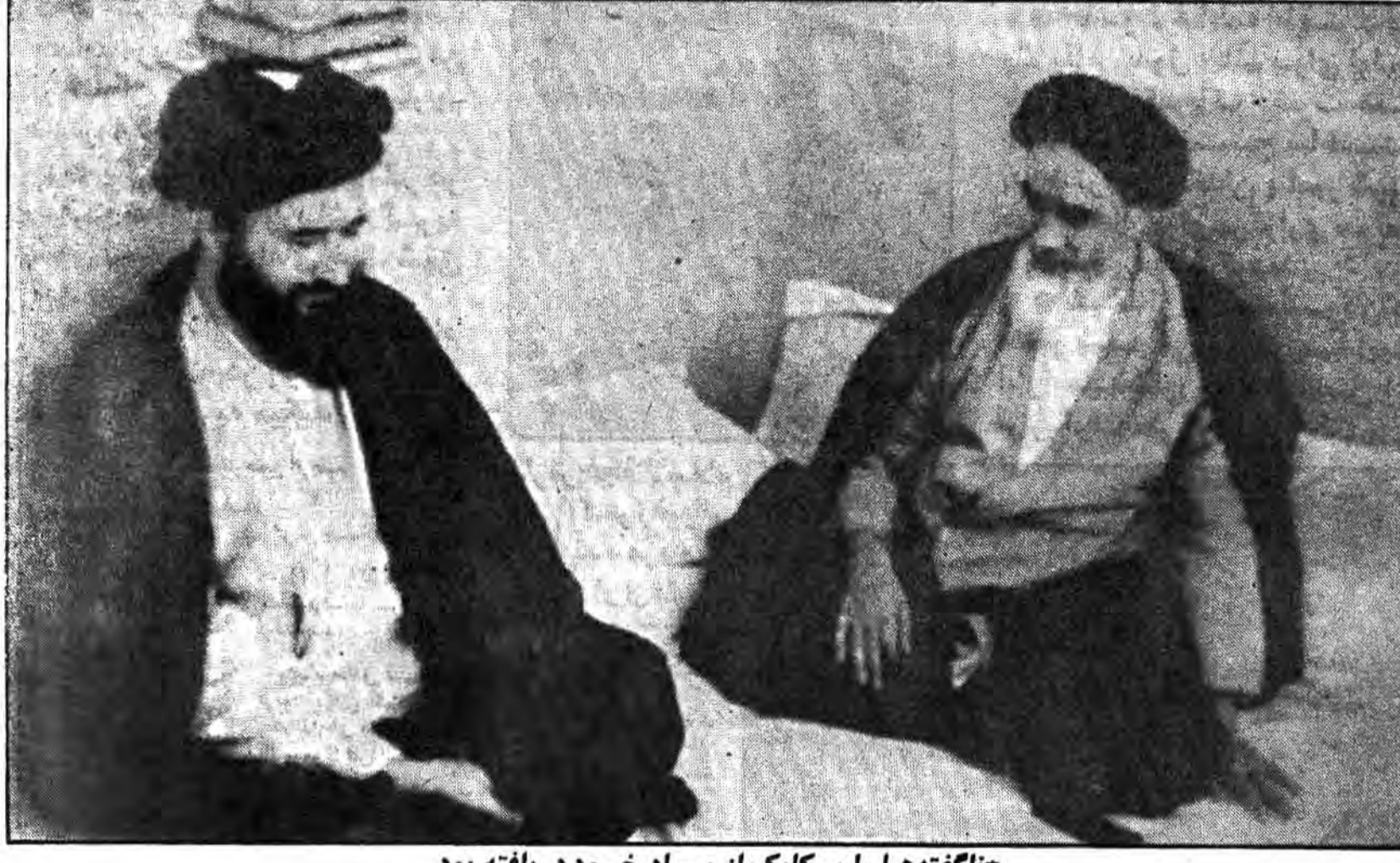
«ناگفته‌ها را یکبار از مراد خود دریافته بود.»

سیدمصطفی خمینی در ذیحجه ۱۳۹۷ قمری در سن ۴۷ سالگی، بگونه‌ای مژورانه به شهادت میرسد و دور وطن جان به جان آفرین میسپارد و در تنهیدگاه خویش، یعنی در نجف اشرف در کنار جد بزرگوارش و امام انسانها بخاک سپرده میگردد. اما نکته مهم این است که اگر تاریخ این خاندان را متکریم و وقوع چنین اتفاقی انجام چنین واقعه‌ای را جدید نخواهیم شمرد و آنرا تکرار نداشته، قلنداد نخواهیم کرد. سیدمصطفی فرزند آقا روح‌الله است و آقا روح‌الله فرزند سیدمصطفی و سیدمصطفی فرزند سیداحمد موسوی است. سخن ما درباره زندگی سیدمصطفی (جد حاج آقا مصطفی و پدر امام خمینی) است و اگر با نگاهی عمیق بر زندگی و سرگذشت نظاره افکنیم، بی‌شک نسبت به سخن تکرار تاریخ نظری دیگر خواهیم داشت. و حال برای روشن شدن زندگی سیدمصطفی موسوی، چند کلمه‌ای درباره آن میگوئیم: سیدمصطفی موسوی (پدر امام) پس از اتمام تحصیلات در نجف اشرف و سامرا (در عهد میرزای شیرازی) در زمر علماء و بزرگان آمده و سپس بطرف خمین متوجه گشته و زعامت آن دیار را عهده‌دار میگردد. او در تاریخ ذیحجه سال ۱۳۲۰ قمری، در بین راه خمین- اراک بگونه‌ای مژورانه مورد حمله دژخیمان رضاخان قرار میگردد و بوسیله چند گلوله به شهادت میرسد، و این در حالی بود که او پیش از ۴۷ سال نداشت. پس از شهادت ایشان، جنازه را به نجف اشرف برده و در ۴- هر دو در سن ۴۷ سالگی به شهادت رسیده‌اند. ۵- هر دو با شیوه‌ای مژورانه به شهادت میرسد. ۶- مدفن هر دو در نجف اشرف است. ۷- بدین گونه است که، گوئی تاریخ تکرار میشود، و دو مصطفی، شایسته عجب بخود میگردد.