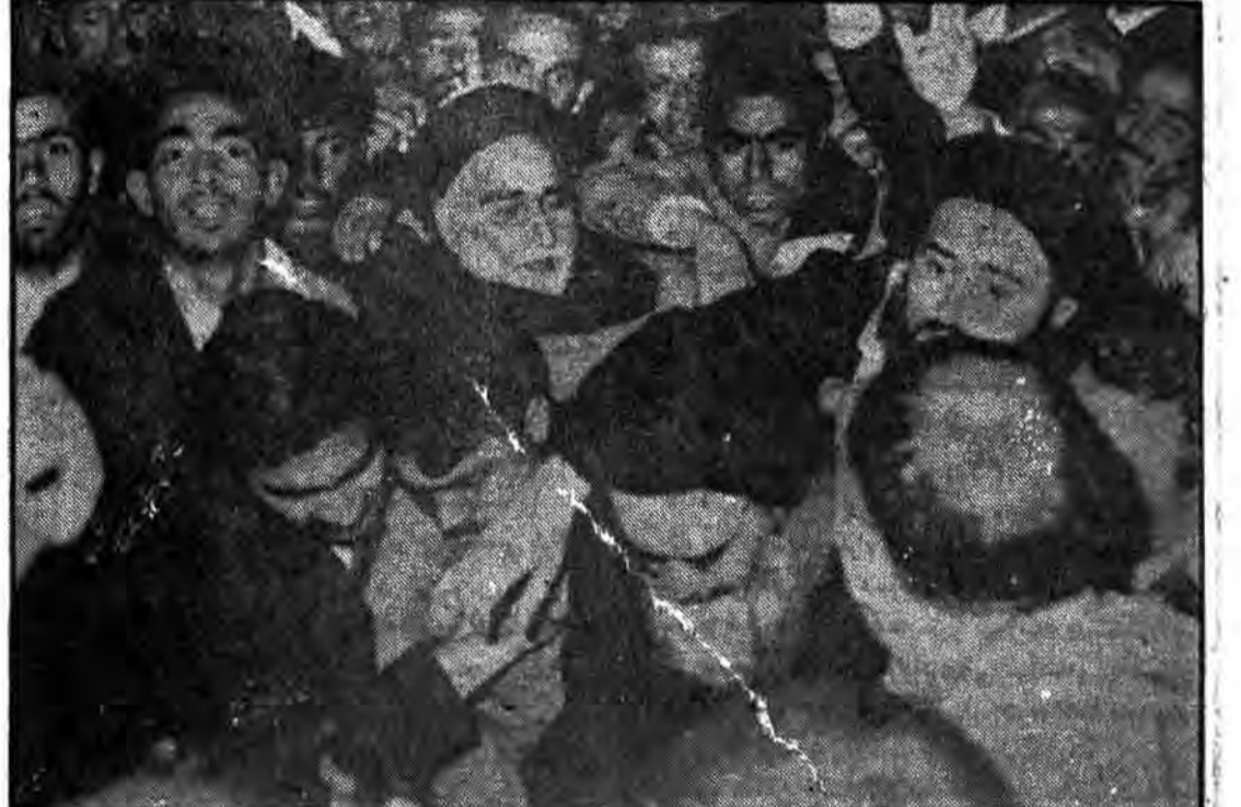
«همگام با پدر، مراد و امام خویش در تمام صحنه‌ها»

تألیف شهید مصطفی خمینی در عین داشتن افتخار نسب و فرزند ارشد رهبر عظیم‌الشان انقلاب اسلامی ایران بودن، خود شخصیتی به نام و مستقل بوده و از ویژگیها و خصائص بسیار عالی و ارزشمندی برخوردار بود. در وجود او، از آغاز دوران تحصیل بخاطر داشتن استعداد قوی و فوق‌العاده که با تقوی و ایمان وی توأم شده بود،