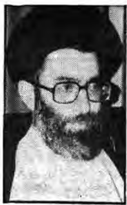
رئیس کنونی مجلس شورای اسلامی

کارکنان روابط عمومی مجلس شورای اسلامی پیرش با آقای سیدعلی خامنه‌ای رئیس جمهوری دیدار کردند. در این دیدار آقای خامنه‌ای طی سخنانی با اشاره به رابطه ستولان و مردم گفت: از خصوصیات مهم انقلاب اسلامی این است که دولت و ملت با هم یکی شدند و این یک امر خاص است که مردم در امور دولت و اظهار نظر میکنند و رای میدهند و دیپلمات‌ها را برایشان حرکت میدهند و در همین رابطه است که ستولان دولتی با مردم همیشه در صحنه مشورت میکند.