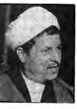
رئیس مجلس شورای اسلامی

بناظر من اینطور می‌آید که مردم در میان علماء توجه بیشتری به آیت‌الله منتظری دارند.