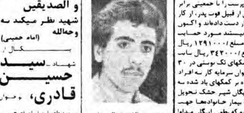
Portrait of a man, likely a religious leader or official mentioned in the text.