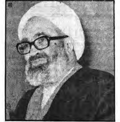
سفرا و کارداران جدید ایران در کشورهای رومانی، بلژیک، سوئیس، مجارستان و سرکشول ایران در شوری روز دوشنبه گذشته با قیام علیقدر حضرت آیت‌الله العظمی منتظری دیدار کردند.

بگزارش خبرگزاری جمهوری اسلامی در این دیدار حضرت آیت‌الله العظمی منتظری طی سخنانی اظهار داشتند: شما آقایان توجه دارید در این کشورها نماینده انقلاب اسلامی ایران هستید و ملت‌ها از شما انتظارات دیگری دارند عمل و رفتار شما باید متناسب با دستورات اسلام باشد سعی کنید نیروهای معتقد به