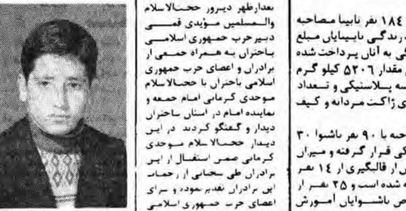
Portrait of a man, likely a religious leader or official mentioned in the text.