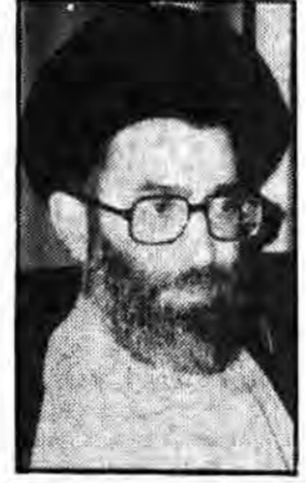
مردمی به پیروزی رسانده‌اند که از رهبری حکیمانه و دقیق نیز برخوردار بوده و هستند- رهبری هستند- بطور طبیعی و منطقی در جایی که مردم انقلاب را به پیروزی میرسانند پاسدار- حامی و نگهدارنده آن نیز خود مردم هستند و این فلسفه ارتش بیست میلیون است ایشان گفتند- ارتش بیست میلیون است که به فرمان امام امت تشکیل شده است برای حفظ شیرین‌ترین میوه وجود این ملت- در طول تاریخ تشکیل شد تا بتواند اثر آن در دست چابول غارت‌گران حفظ نماید.

از آغاز ساله موجود آمده باشد و تاریخ سوسی انحراف کشیده می‌شود ایشان گفتند: در کشور ما هیچ گروه-فکر-سطح بسیج میلیونی اشاره کرد و گفت در کشورهایی که کوتاهی توسط مسئولین پایگاه‌های واحد بسیج مستضعفین سپاه پاسداران انقلاب اسلامی سراسر کشور که جهت برگزاری مسابقات روزهای بهمنیست هفته بسیج به تهران آمده‌اند در اولین روز این مسابقات با حجت‌الاسلام والمسلمین آقای سیدعلی خامنه‌ای رئیس‌جمهوری دیدار کردند. در این دیدار ابتدا حجت‌الاسلام سالد مسعودی و واحد بسیج مستضعفین سپاه پاسداران انقلاب اسلامی از عملکرد این واحد از بدو تأسیس تاکنون گزارشی به استحضار رئیس‌جمهوری رساند. آنگاه حجت‌الاسلام والمسلمین آقای خامنه‌ای با اشاره به چگونگی پیروزی انقلاب دیگر در دهه‌های اخیر در کشورهای مختلف جهان به وجه تمایز انقلاب اسلامی با آنها اشاره کردند و ضمن تاکید بر مردمی بودن انقلاب اسلامی ایران گفتند: اگر مردم یک کشور با انقلاب هماهنگ و هم‌آواز و همراه نباشند اگر آن انقلاب