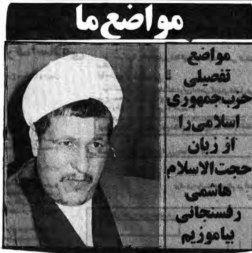
مواضع ما مواضع تفصیلی حزب جمهوری اسلامی را از زبان حجت الاسلام هاشمی رفسنجانی بیاموزیم

اینها در برزخ است این عذاب خدا چیست که نازل میشود بر آنها؟ آتش است که