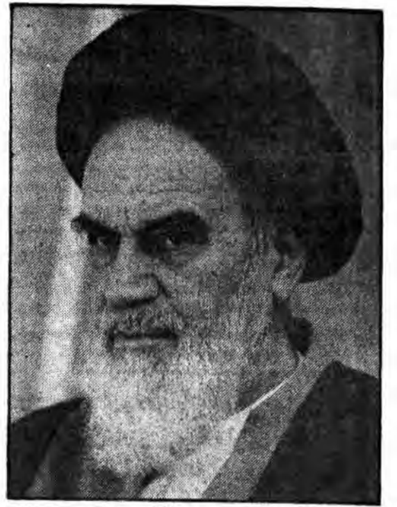
این مجلس دارای اهمیت ویژه می باشد... امید است علماء اعلام کثرت الله امثالهم هم خود شرکت نمایند و هم ملت را ارشاد فرمایند. در صفحه ۱۲