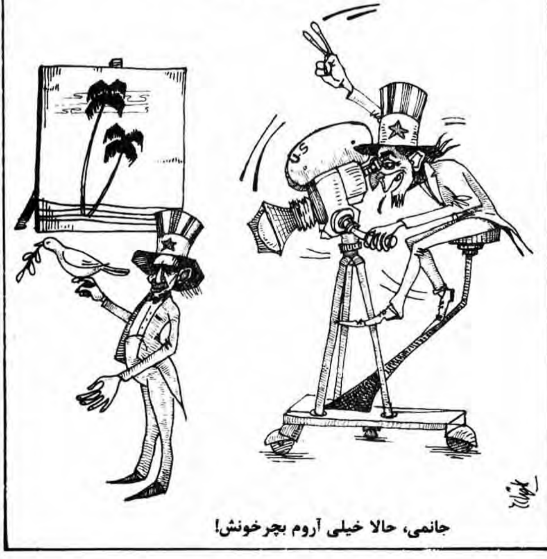
جانمی، حالا خیلی آروم بچرخون!