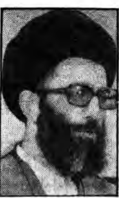
سایت دینی سواد دین و علم... (Caption describing the image, likely related to the religious or educational theme of the page.)

گروهی از اساتید و پژوهشگران شاخه دانشجویی حزب جمهوری اسلامی با تعلق از نمایندگان انجمنهای اسلامی دانشجویان و تسهیلاتی از اساتید دانشگاههای سراسر کشور در بیانیه‌ای نسبت به مسئله علم و دین در کشور ایران و به ویژه در مورد نیاز جامعه به تلفیق و حفظ علم و دین در کشور، به بیانیه‌ای رسیده است. این بیانیه که در روزنامه «جمهوری» منتشر شده است، در آنجا که به مسئله علم و دین در کشور ایران و به ویژه در مورد نیاز جامعه به تلفیق و حفظ علم و دین در کشور، به بیانیه‌ای رسیده است. این بیانیه که در روزنامه «جمهوری» منتشر شده است، در آنجا که به مسئله علم و دین در کشور ایران و به ویژه در مورد نیاز جامعه به تلفیق و حفظ علم و دین در کشور، به بیانیه‌ای رسیده است.