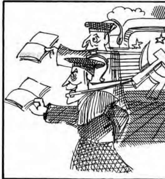
بکار خواهند نشست بلکه بدان معنات که هر کس خود را با حرکت سریع انقلاب همراه کند عقب خواهد ماند. و ما شاهد این آغاز هستیم و شاهد تخصصی

بسیاری از نیروهای متعهد را به خود جذب نمود. البته کار جهاد دانشگاهی تنها انجام تحقیقات و کمک به راه اندازی صنایع نبوده بلکه از بند تشکیل این نهاد تاکنون بسیاری از این استعدادها یافته شکوفا شده اند و تخصصهای فنی بالا برود همه اعضای جهاد طی دورههای آموزشی مختلف سطح معلومات فنی خود را بالا بردند یعنی در حقیقت برای جبران خرد شدن معلومات سواد دانشگاهی خود جهاد به خود جلب نمود. البته کار جهاد دانشگاهی تنها انجام تحقیقات و کمک به راه اندازی صنایع نبوده بلکه از بند تشکیل این نهاد تاکنون بسیاری از این استعدادها یافته شکوفا شده اند و تخصصهای فنی بالا برود همه اعضای جهاد طی دورههای آموزشی مختلف سطح معلومات فنی خود را بالا بردند یعنی در حقیقت برای جبران خرد شدن معلومات سواد دانشگاهی خود جهاد به خود جلب نمود. البته کار جهاد دانشگاهی تنها انجام تحقیقات و کمک به راه اندازی صنایع نبوده بلکه از بند تشکیل این نهاد تاکنون بسیاری از این استعدادها یافته شکوفا شده اند و تخصصهای فنی بالا برود همه اعضای جهاد طی دورههای آموزشی مختلف سطح معلومات فنی خود را بالا بردند یعنی در حقیقت برای جبران خرد شدن معلومات سواد دانشگاهی خود جهاد به خود جلب نمود.