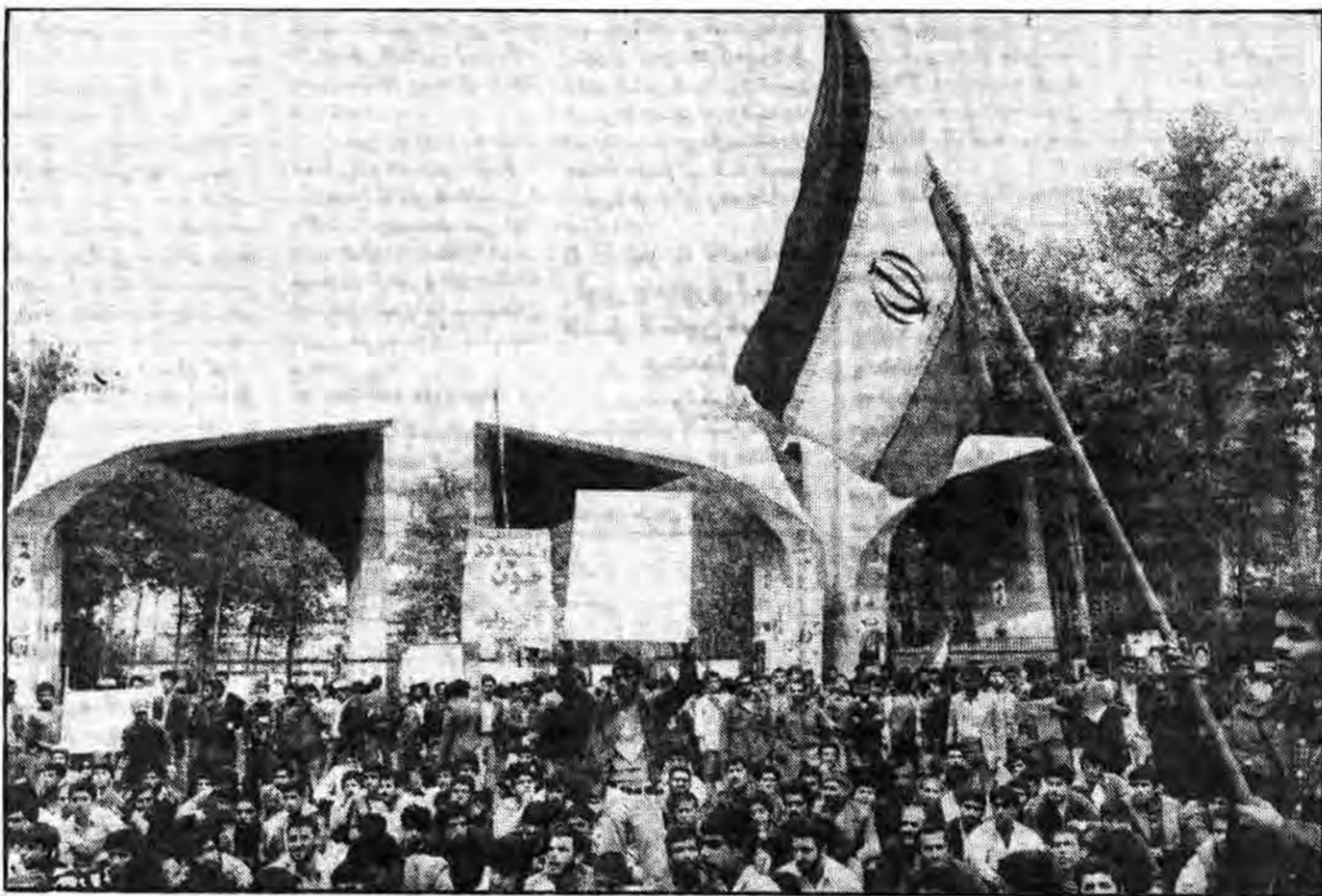
دانشگاهی با ترجمه و تألیف کتب برطرف نموده و این عمل یعنی تألیفات همراه تحقیقات

سرویس گزارش - اکنون که انقلاب اسلامی ما در جهت ساختن جامعه نوین گام بر می دارد و اکنون که واژهها و ارزشها در حال دگرگونی اصولی است، میبایست بسیاری از واژهها و ارزشها را دوباره معنا کرد و مفاهیم آنها را با خواست فطرت انسانی و حرکت انقلابی اسلام همسو نمود و دانشگاه یکی از این واژههاست. در گذشته دانشگاه سبیل مسدود و سدسازی فقر تحصیل کرده از مردم محروم جامعه بود. در آن زمان اکثر افرادی که قدم به دانشگاه می گذاشتند گویی واقعیتهای جامعه را فراموش کرده و بدون در نظر گرفتن فرهنگ و خواستهای مردم رو به مسائلی می آوردند که نه در این جامعه جایگاهی داشت و نه در حل مشکلات این مردم اثر می گذاشت. لذا علم در دانشگاه برای علم تدریس میشد و هر آنکه علم را برای درمان دردهای مردم محروم جامعه بکار می برد مرتجع خوانده میشد. در آن دوران سبیل که علم آلت دست مستکبران جهانی بود و به جوانان مسلمان که میخواستند از علم برای مردم استفاده کنند، مارک از تاج، و واپس گرای زده میشد. هم علم و هم مسلمانان مسلمان مظلومانه قربانی واژهها و اسیر دست مستکبران بودند. ولی اکنون که همراه تولد دوباره انسانیت انسان و فطرت خداچوپایه او علم راستین نیز متولد میشود، دانشگاه، دانشجو، استاد و دانشجو را دوباره باید معنا کنیم. و با تکیه بر مفاهیم حقیقی آنها در جهت نوآوریهای علمی و ارتباط دادن علم با زندگی محرومان و وسیله قرار دادن برای تسلی انسان و حرکت انقلابی اسلام قدم برداریم. اکنون که پیش از ده سال از شروع انقلاب فرهنگی می گذرد و اکنون که واحدهای آموزشی، رفته رفته تجدید حیات کرده و شروع به بازگشایی کرده اند لازم است تفسیرات اساسی که در این راه انجام گرفته و ارزشهای نوینی که بوجود آمده اند برای جامعه روشن شوند.