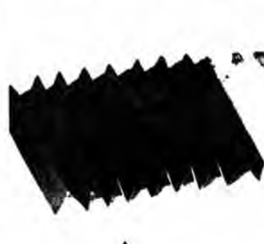
برای شکوفه ها به کوشش شهلا بارفروش