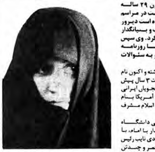
یک زن آمریکائی در دیدار با امام: سیاهپوستان آمریکائی از من خواستند سلامشان را بشما برسانم